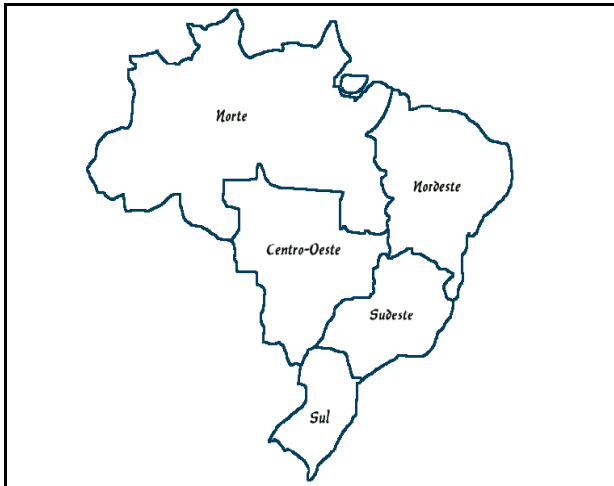
Figura 1 – Regiões Administrativas do Brasil Figura 2 – Região Sudeste do Brasil (SP, BH, RJ)