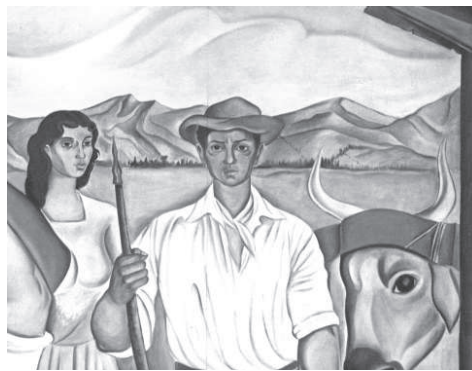
Figura 10. La familia. (Fotos Teresita Chavarría).