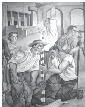
Figura 6. Las obras públicas. (Foto Teresita Chavarría).