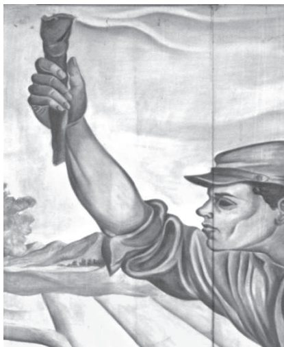
Figura 11. La antorcha de la libertad. (Foto Teresita Chavarría).

Finalmente, en el fondo, un inmenso campo sobre el que se extiende una montaña azul, la cual recorre todo el mural y el cielo resplandeciente bajo la luz de la antorcha que sostiene el héroe nacional Juan Santamaría, simbólicamente representa el máspreciado anhelo del costarricense: la libertad (Figura 11).