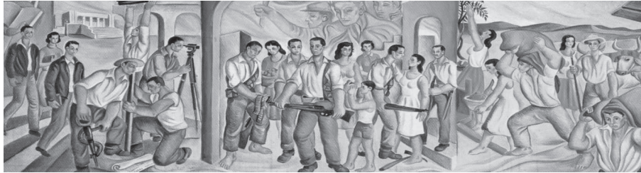
Figura 2. Boceto para el concurso. (Propiedad del Instituto Nacional de Seguros).

En el mural de Ranucci, se exaltan los valores de la educación, el trabajo agrícola, la industria, las obras públicas y especialmente, los valores cívicos, simbolizados por la presencia de los próceres y los jóvenes que participaron en la guerra civil del cuarenta y ocho, que acabó con el viejo sistema político costarricense, para dar paso a la modernización de Costa Rica, a partir de la década de los cincuenta.