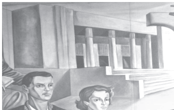
Figura 5. El Paraninfo.