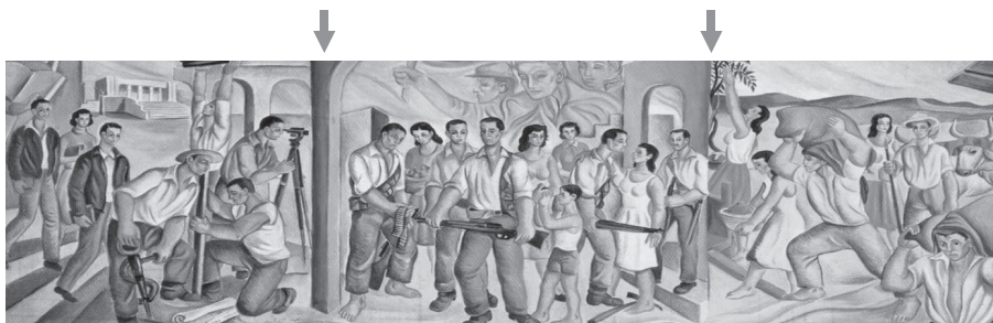
Figura 3. La división por módulos. Fuente [www.elespiritudel48.com]. 2006.

El mural está organizado por unas ventanas o módulos a manera de división que dan paso de una a otra escena, sirviendo de enlace a la composición (ver flechas) (Figura 3).