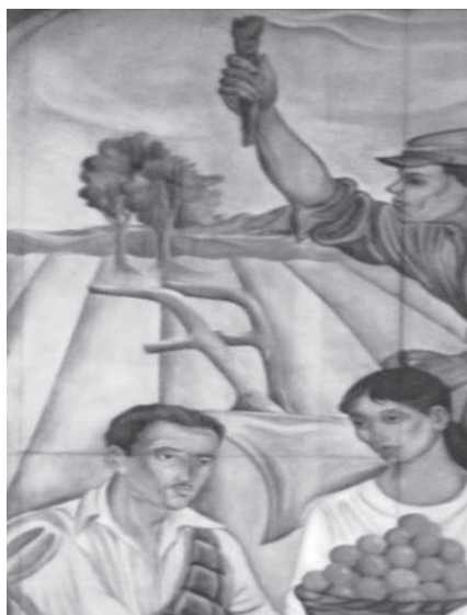
Figura 8. Campo de siembra y arado azul. (Foto Teresita Chavarría).

En el fondo de esta escena, en tercer plano, se representa un campo de siembra y un arado azul, que significa la herramienta con que se abre el nuevo surco de la Costa Rica de la segunda mitad del siglo XX (Figura 8).