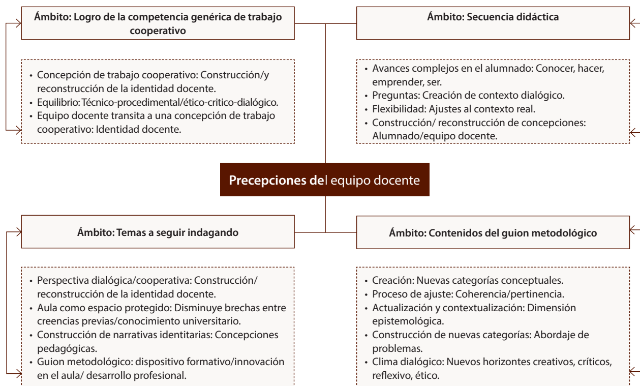
Figura 2: Percepciones del equipo docente

Nota: Elaboración propia a partir del análisis de las categorías identificadas.