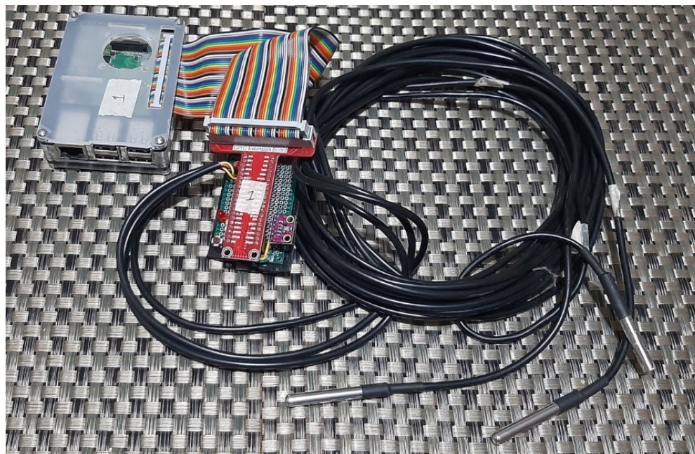
Figura A2: Hardware, circuitería y cableado del laboratorio remoto