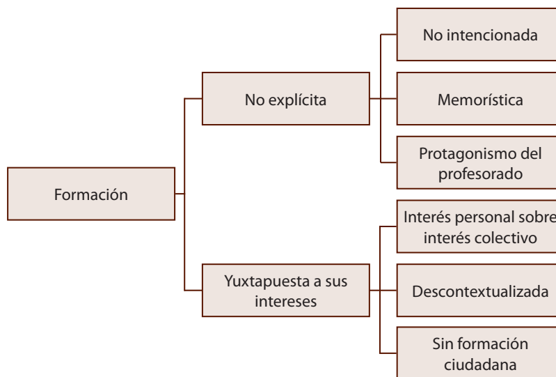
Figura 1. Categorías asociadas a la formación ciudadana recibida en la escuela. Elaboración propia a partir de los resultados arrojados por el programa Atlas ti.

Dos grandes categorías emergen en relación con la percepción que poseen los estudiantes sobre la formación ciudadana que reciben en la escuela, las que para mayor claridad han sido resumidas en la figura 1.