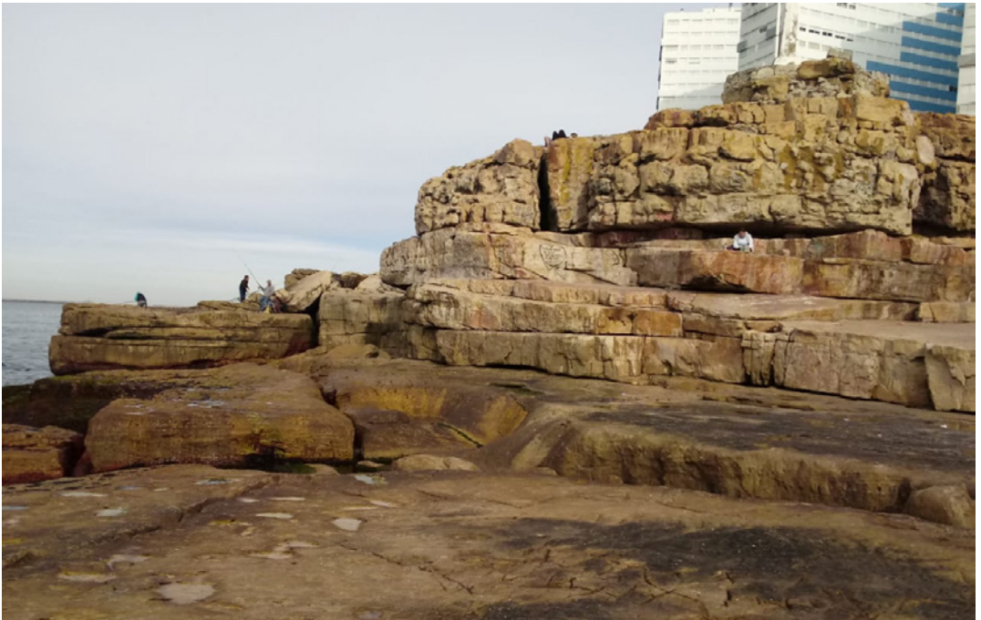
Figura 4. Estribaciones del sistema de Tandilia.

Las rocas cuarcitas que constituyen el sistema serrano en el tramo del partido de General Pueyrredon son aprovechadas por la actividad minera para la industria de la construcción. La roca extraída es utilizada para el revestimiento de viviendas y veredas y la construcción de escolleras en la localidad de Mar del Plata. En el kilómetro 8.5 de la Ruta N° 88 se encuentran canteras a cielo abierto abandonadas que generan paisajes de aprovechamiento turístico, aunque la actividad no se halla regulada.