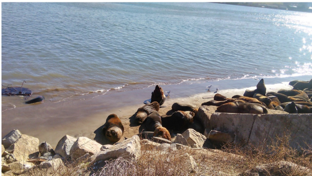
Figura 3. Lobería Escollera Sur.