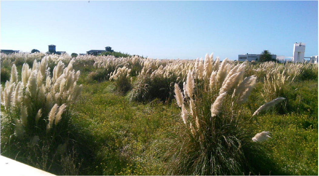
Figura 2. Reserva Natural Puerto Mar del Plata.

La colonia posee un carácter no reproductivo, al estar integrada casi exclusivamente por ejemplares machos. Esto se debe a que la especie posee un sistema de reproducción de tipo harén (Jefferson, Leatherwood, y Webber, 1993). Esta situación genera un excedente de machos, tanto los senescentes, los lesionados, los juveniles, entre otros, que tienden a agruparse para su protección en colonias no reproductivas.