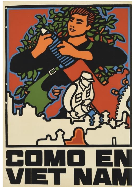
Figura 2. René Mederos. Como en Vietnam. (1970)