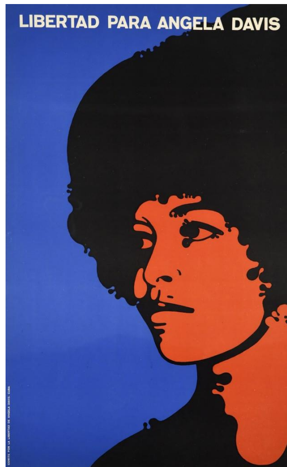
Figura 5. Félix Beltrán. Libertad para Ángela Davis. (1971).

presa política de conciencia, producto de la evidente desigualdad en la sociedad norteamericana de las décadas entre los cincuenta y los setenta. Claro está que, para el régimen cubano, la disidencia política es justificable en cualquier territorio menos en el propio.