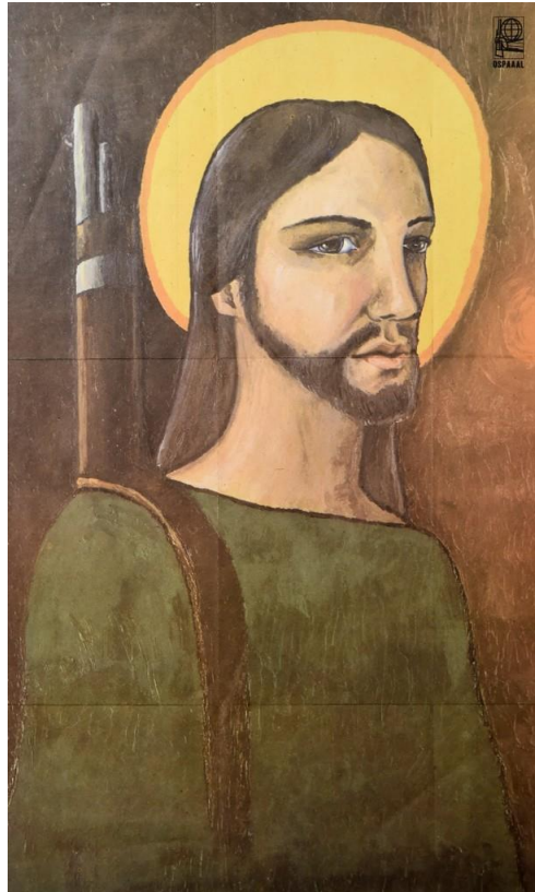
Figura 3. Alfredo González Rostgaard. Cristo Guerrillero. (1969)

que recibieron de sumo grado el símil de Cristo como el primer revolucionario y subversivo ante el poder dominante imperial.