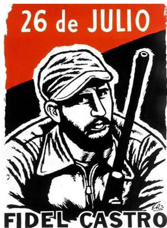
Figura 1. Eladio Rivadulla Martínez. 26 de julio de 1959–Fidel Castro.

Como señala González Pastrana (2010), fue evidente la necesidad de transmitir mensajes que ideológicamente unificaran a la población, que pudieran ser masivamente distribuidos y servieran , no solo para la formación política, sino también cognoscitivo-educativa en todas las esferas de la vida social (p. 69). Para esto, fue necesario el carácter e inmediatez que ofrecía el cartel como medio para saturar el conglomerado social y para desvincular este formato de cartel de patrocinadores particulares que se articulaban al conjunto de los organismos del Estado —y posteriormente del Partido Comunista de Cuba—, quienes serían los encargados de construir el nuevo orden social acorde con los valores y aspiraciones del Partido Comunista como representante y garante de la sociedad cubana (González-Pastrana, 2010, p. 69). Al mismo tiempo, otros formatos como las vallas y los laminados se