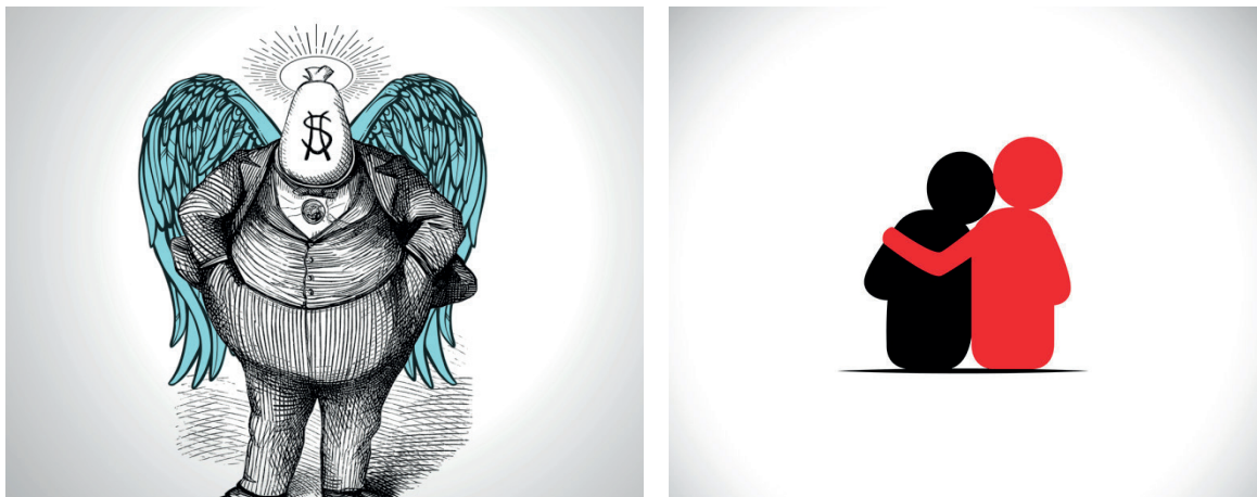
Figura 2. Una representación que muestra el contraste entre avaricia y filantropía.

significa lo mismo que caridad, término con el cual se le asocia a menudo, la que según la RAE es una actitud solidaria con el sufrimiento ajeno o un auxilio que se presta a grupos necesitados. Como el ying y el yang, la avaricia es también parte de la historia de la humanidad, su contraste con la filantropía resulta evidente al igual que su representación ( Figura 2 ).