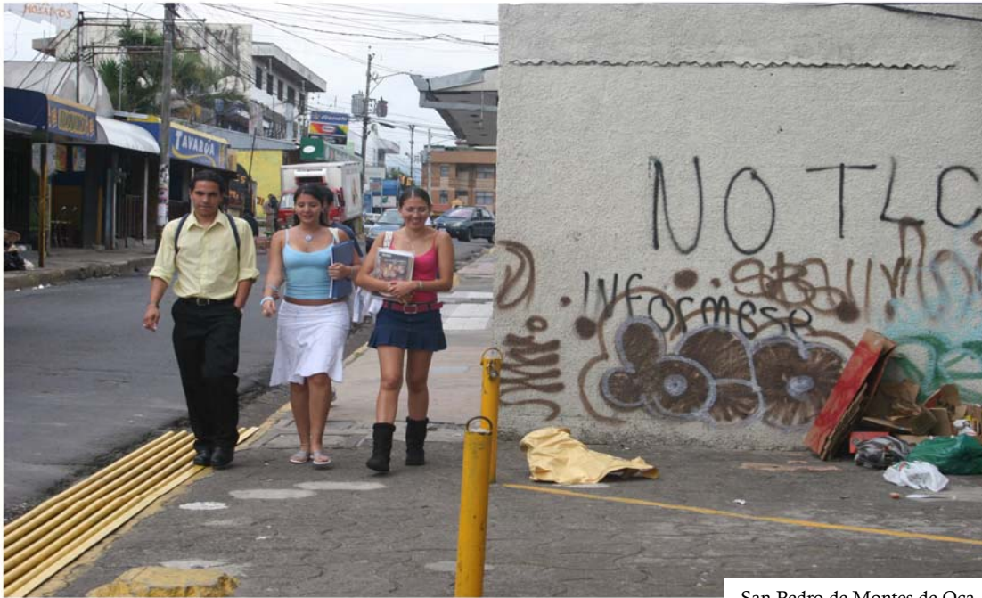
San Pedro de Montes de Oca

invenciones creadas sobre los recursos biológicos puede ser muy variable, atribuible principalmente a los esfuerzos del inventor y a las actividades de comercialización del dueño de la patente (IP/C/W/257, párrafo 156; IP/C/W/236). Estados Unidos insistió recientemente (IP/C/W/449 6-2005, párrafos 11 y 23) en que un nuevo requisito de divulgación para patentar no es la solución apropiada, siendo primero necesario que los países establezcan sus sistemas nacionales de acceso y distribución de beneficios antes de empeñarse en una discusión de requisitos de divulgación adicionales.