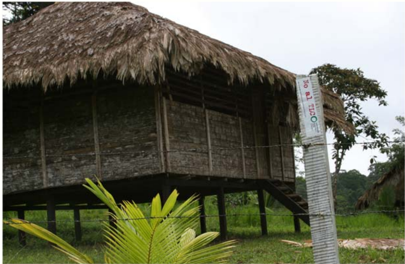
Limón, Costa Rica