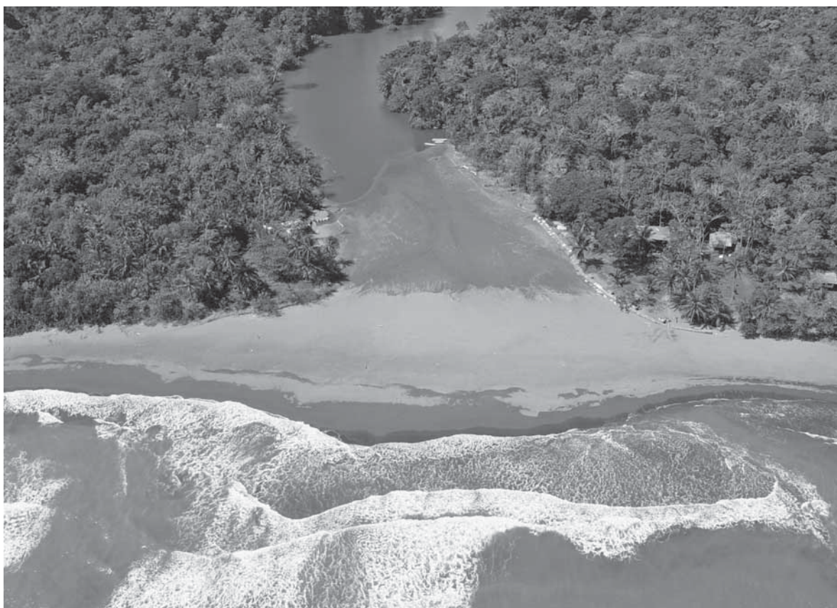
Desembocadura de río, Costa Rica.