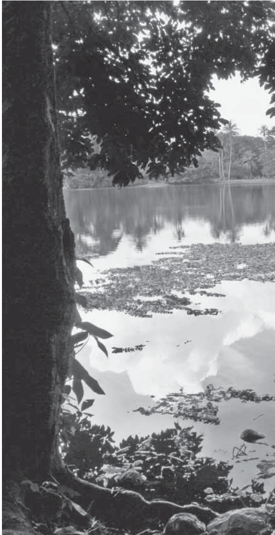
Tortuguero, Costa Rica

las redes y las artes de pesca en general que, en función del tipo de barco, maniobra de pesca o especie, no sean los fijados para las capturas; (j) emplear redes agalleras y redes de arrastre pelágicas de altura; (k) realizar toda práctica que atente contra la sustentabilidad del recurso pesquero, y (l) utilizar embarcaciones sin su