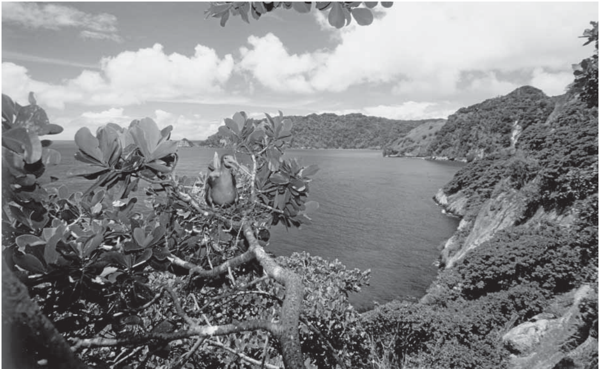
Isla del Coco, Costa Rica