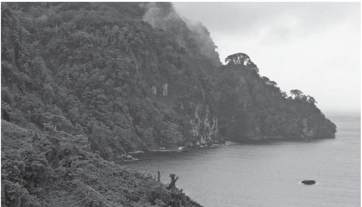
Isla del Coco, Costa Rica

Coopetárcoles, una de las pocas cooperativas de pesca artesanal en Costa Rica, tiene su sede en la comunidad de Tárcoles (cantón Garabito, golfo de Nicoya, costa pacífica). Fue creada en 1980 con el fin de comercializar directamente el producto, financiar equipo de pesca y capacitar a los pescadores. Tiene 20 años de trabajo permanente y servicio a la comunidad. Cuenta con 31 socios activos: 26 hombres y 5 mujeres. Sus