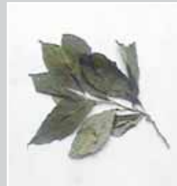
En vías de identificación