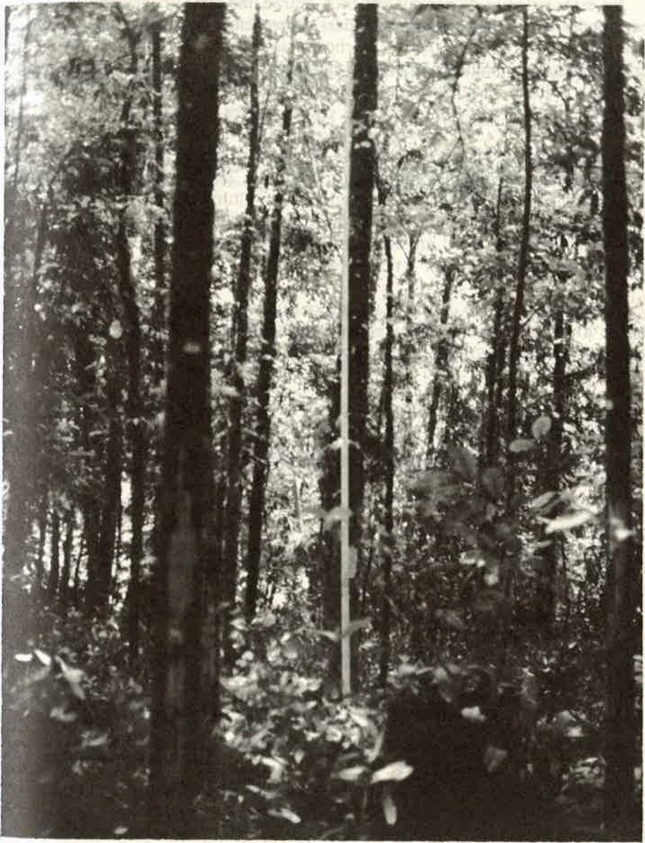
FIGURA 2. Plantación de V. hondurensis de 12 años en La Marina de San Carlos, Costa Rica, 1992.