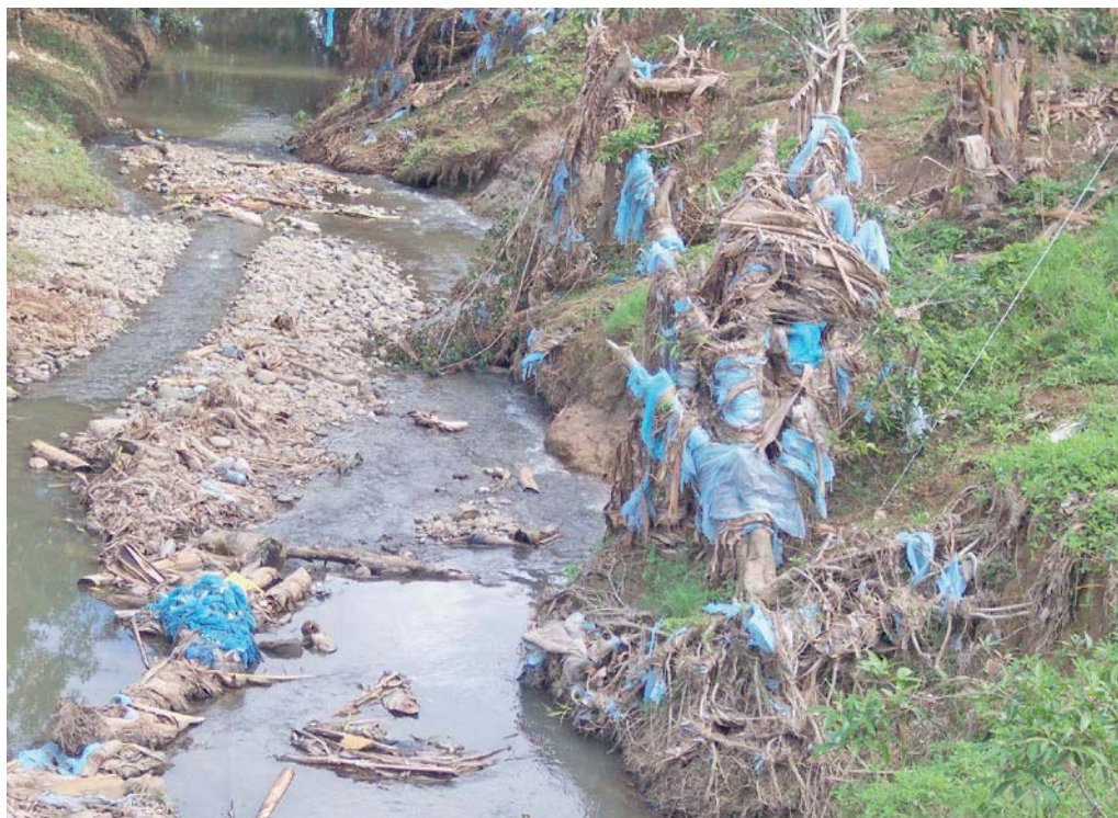
Carlos Arguedas. Río Barbilla, Costa Rica

Los sistemas de tasación, además, pueden variar en cuanto a su aplicación y resultados. Es posible gravar solo a un grupo de contaminadores con impuestos suficientemente altos como para cumplir con un determinado estándar de calidad del agua. Otro enfoque consiste en que todas las empresas cumplan con una cierta norma de reducción de emisiones para alcanzar el estándar necesario (Boyd, 2003). Únicamente con el primer enfoque se logra la flexibilidad requerida para gravar a los agentes según sus costos marginales. Como resultado, se puede alcanzar un determinado nivel de calidad de agua más barata (para la sociedad) con un impuesto flexible, que si se aplicara una tasación uniforme (ver recuadro 1).