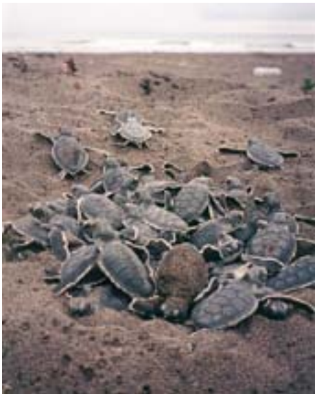
Sebastian Troeng. Tortuga lora ( Lepidochelys olivacea )

A partir de pruebas de comparación de medias, los valores de temperatura de las nidadas (A), (C) y (F) presentaron un valor P < 0,05 . Esto reflejó diferencias significativas respecto a la temperatura control, durante los días de incubación 24, 23 y 7, respectivamente, los cuales corresponden al 3 de noviembre. Los huevos pertenecientes a (D) y (E) mostraron un valor P < 0,05 los días 15 y 14, coincidentes con el 2 de noviembre. La nidada (B) obtuvo un valor P < 0,05 el día 25 de su período de incubación, alcanzado el 4 de noviembre.