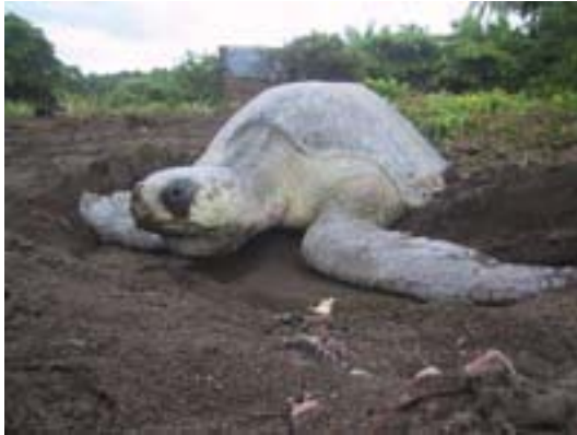
Sebastian Troeng. Tortuga lora ( Lepidochelys olivacea )

Playa Tortuga se ubica en Ojochal, distrito de Puerto Cortés ( 83^{\circ}40'3.36'' O, 9^{\circ}4'32.16'' N), perteneciente al cantón de Osa, en la provincia de Puntarenas, Costa Rica. Consta de una extensión de 2 km, limita en su parte norte con las rocas de playa Ventanas y al sur con la desembocadura del río Grande de Térraba. Además del río Térraba, playa Tortuga recibe la influencia directa de los ríos Tortuga por el extremo norte y Balso por el extremo sur (figura 1).