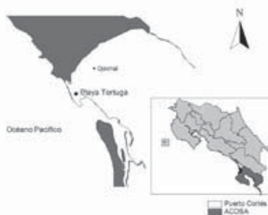
Figura 1. Ubicación geográfica del área de estudio.