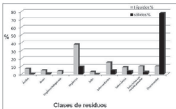
Figura 2. Distribución porcentual de residuos químicos inventariados en la UNA.

Las clases de residuos líquidos más comunes almacenados en los diferentes laboratorios son principalmente los disolventes orgánicos, los cuales se guardan en el 100% de las unidades académicas, centros e institutos evaluados. Otros residuos almacenados en la mayoría de las áreas son los que corresponden a la clase de disoluciones con metales pesados, sales oxidantes y sales tóxicas. Residuos como disoluciones ácidas y bási-