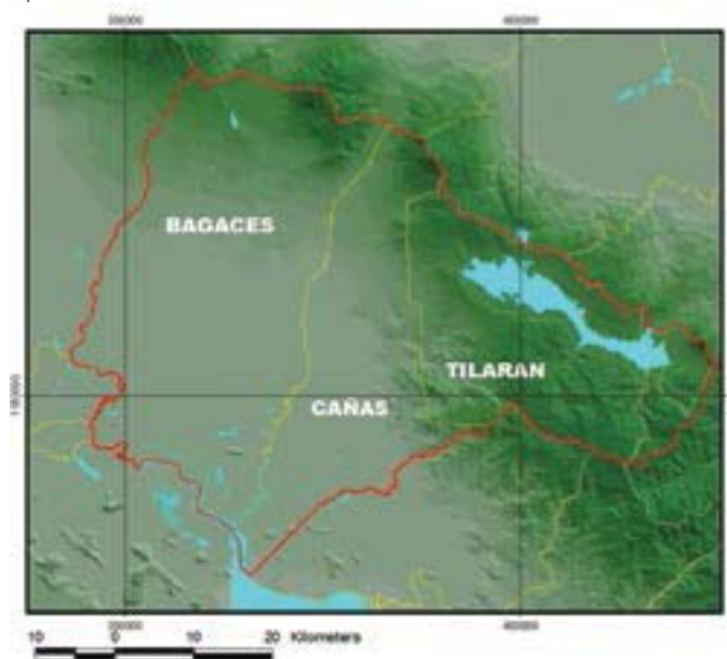
Figura 1. Área de influencia de Cidecat en cuencas Arenal y Tempisque.

Con el pasar del tiempo fue necesaria la incorporación de la parte baja de la cuenca del río Tempisque en vista de que gran parte de la actividad socioeconómica que ahí se desarrolla depende del recurso hídrico que se genera en la cuenca del embalse Arenal. Lo anterior trajo como consecuencia la integración de más instituciones clave: la Organización para Estudios Tropicales (OET), el Instituto de Desarrollo Agrario