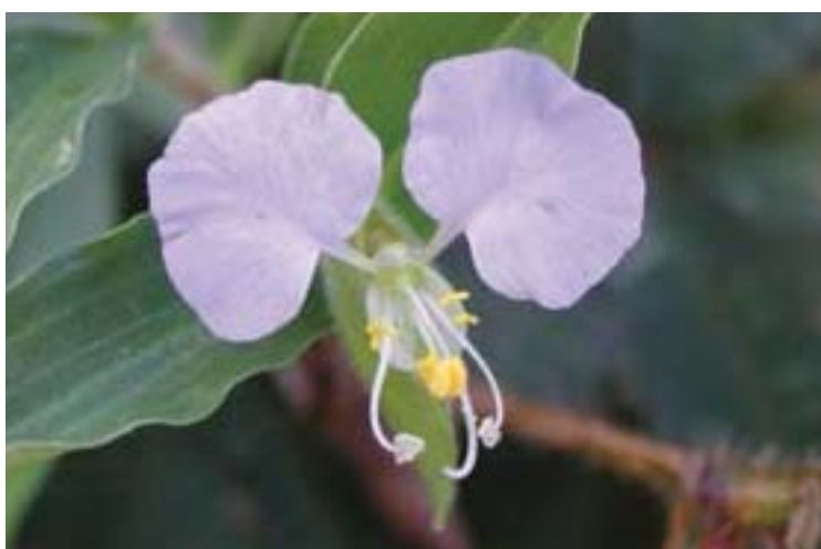
Arriba: Hongos. Abajo: Siempre viva, Federico Rizo-Patrón

Área de Conservación Arenal Tempisque del Sistema Nacional de Áreas de Conservación (Acat-Sinac), Instituto Costarricense de Electricidad (Ice), Servicio Nacional de Aguas Subterráneas, Riego y Avenamiento (Senara), Fundación para el Desarrollo del Área de Conservación Arenal-Tempisque (Fundaca), Instituto Costarricense de Acueductos y Alcantarillados (AyA) y la Diócesis de Tilarán.