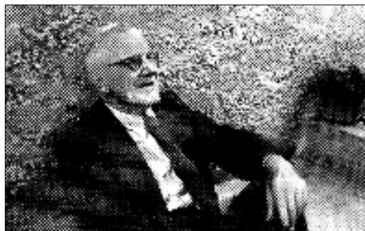
Henri Pittier 1857-1950

The first Meteorological Service in Costa Rica was created on April 7 th 1888 by Mauro Fernandez, while the government of Bernardo Soto; and it was part of the Physic's Geographic National Institute. Its first director was the Swiss scientist, doctor in Sciences, Henri Pittier, during 16 years (1888-1904). Its first location was the Liceo of Costa Rica that was founded one year earlier; doctor Pittier was professor at the same institution. He made his firsts observations of rainfall and temperature in San Jose, and he also studied the conditions of the country's climate.