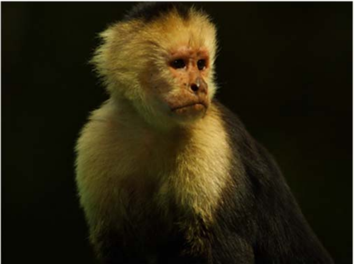
Mono cara blanca

Las trampas fueron realizadas durante la tarde y se revisaron durante dos días seguidos. Si la huella humana aún estaba presente, la trampa había estado activa durante la noche anterior; si no era posible observarla, no había forma de saber si la trampa había sido visitada por algún animal (las huellas de posibles animales se podrían haber borrado al igual que la humana). Se reemplazó el cebo en casos donde éste hubiese sido lavado por la lluvia o comido por las hormigas. La identificación de huellas se realizó con la guía de Aranda (2000).