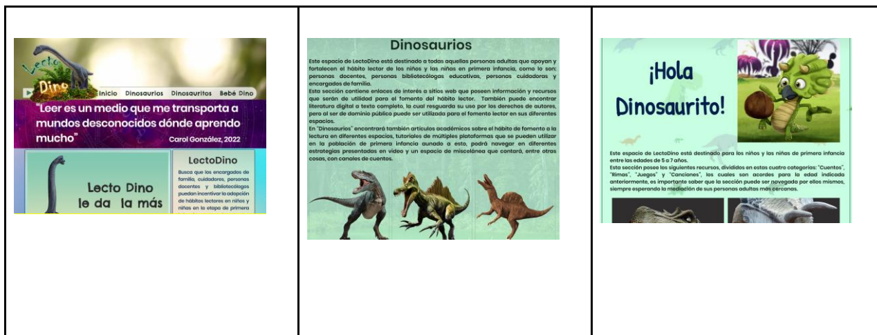
Tabla 3 Capturas del sitio web LectoDino