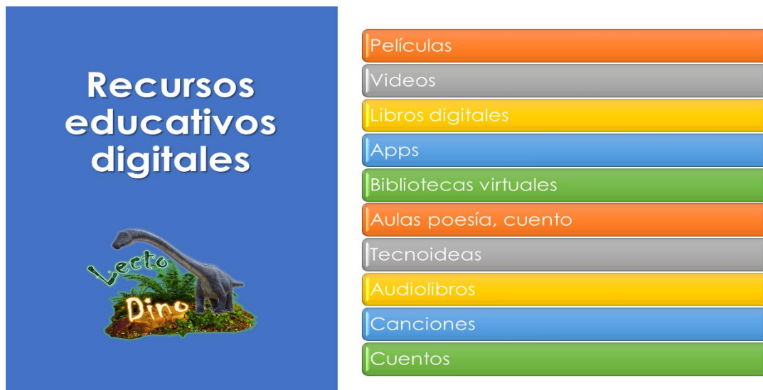
Figura 3 Recursos educativos digitales