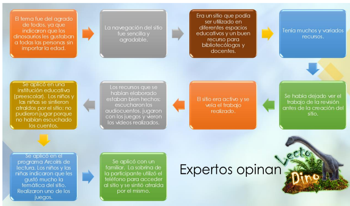
Figura 4 Recomendaciones de expertos

Luego del grupo focal, se efectuaron las observaciones pertinentes para el desarrollo del hábito lector dentro de la línea bibliotecológica de lectura recreativa, ya que, dentro del grupo focal, se hicieron observaciones pedagógicas útiles dentro de las metodologías de la enseñanza de la educación preescolar o para el desarrollo de las competencias lectoras aplicadas en el área de la educación del español, pero se alejan del objetivo que persigue el área de la bibliotecología: incentivar o fomentar el hábito lector usando las lecturas recreativas, que son aquellas escogidas en libertad por cada persona y que buscan propiciar el gozo de leer.