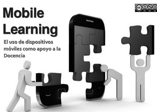
Figura 2. Mobile Learning (Marquina, 2013)

Como lo muestra la figura 2, el aprendizaje a través de tecnologías móviles es una construcción y está en “construcción”, dado que su implementación aún no ha sido muy difundida, por la serie de factores que hay que tomar en cuenta para su exitosa inclusión en el proceso educativo del estudiantado.