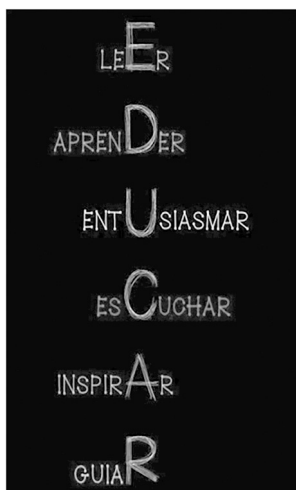
Figura 4. Educar.

Siendo la educación un camino infinito de saberes, surge la siguiente interrogante: ¿Hacia dónde vamos? Vamos hacia entornos más extensos y dinámicos: la realidad virtual y la computación cognitiva. Si bien es cierto que estos conceptos fueron asociados a las películas de cine en ciencia ficción, hoy representan una realidad que se desarrolla en las aulas de nuestros centros universitarios, donde la investigación ha dado paso para que la tendencia popular hacia nuevos entornos pueda ser canalizada para una experiencia educativa sin fronteras, que vincule la educación, la tecnología y la realidad virtual en un espacio tan pequeño o tan grande como lo logre abarcar su imaginación.