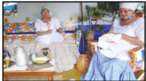
En la foto: concurso Mis valores patrios, semana cívica UNA. Septiembre, 2010

Algunas de esas acciones se ven ejemplificadas en la ejecución permanente de actividades como el Reconocimiento a ambientalistas de larga trayectoria y arraigo comunitario, Semana Cívica, Concursos de decoración de pesebres y oficinas, conciertos navideños y UNA Alegría Navideña, entre otros. Asimismo, el apoyo permanente y solidario a programas y comisiones institucionales como UNA Emprendedores, UNA Campus Sostenible y la Comisión Ambiental Institucional. Este trabajo ha sido posible gracias a la coordinación, participación y el compromiso de diversos académicos y académicas, así como la articulación con diversas organizaciones (Montero, F. 2011).