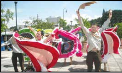
En la foto: presentación grupo de bailes-Promoción Estudiantil, Plaza de la Democracia – San José. Marzo 2011

Día con día la Vice-rectoría de Extensión trabaja en el desarrollo y el fortalecimiento de acciones de promoción cultural y de difusión del quehacer de la Extensión Universitaria. En los últimos años se ha realizado un gran número de actividades académicas entre ellas