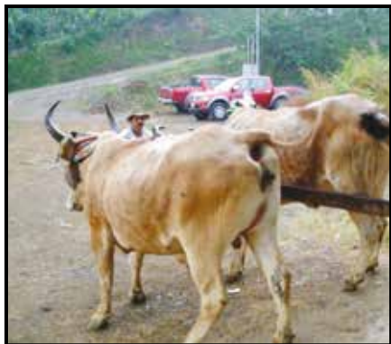
En la foto: Boyero, entregando carga de frijoles, Comunidad de Chánguena, febrero 2011

Es así como académicos de la universidad conscientes de la responsabilidad social que se les concede, han venido desarrollando acciones al servicio de la sociedad que contribuyen a potenciar el desarrollo humano, en un proceso constructivo y de cambio social, de fortalecimiento y rescate de valores, de protección y conservación de los recursos naturales y con ello contribuir al mejoramiento de la calidad de vida.