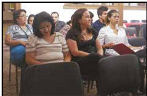
En la foto: Encuentro anual de extensionistas UNA Diciembre, 2010.

asesores, coordinadores y Directores, mediante un marco de diálogo compartan, intercambien experiencias, logros, retos y refuercen lazos que contribuyan a enriquecer la labor de extensión.