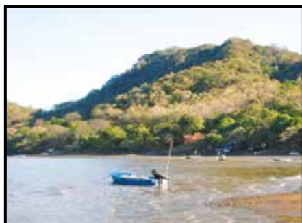
En la foto: Sector Costa de Pájaros. Marzo, 2011

El cuadro 5 de muestra el número de iniciativas clasificadas según área de desarrollo del Plan Estratégico Institucional. En los cinco años de sistematización, tres áreas concentran más del 50% de las iniciativas. Estas áreas son: Educación y Desarrollo Integral, Producción y Seguridad Alimentaria y Sociedad y Desarrollo Humano. Por su parte, el área de desarrollo en la que se llevan a cabo menos iniciativas es Desarrollo Informático, lo cual