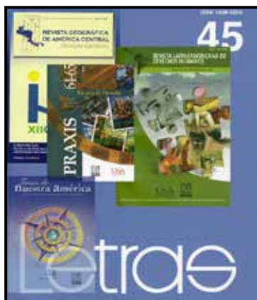
En la foto: portadas de revistas académicas – UNA. Julio 2011

En febrero de 2007, la Vicerrectoría de Extensión elaboró un diagnóstico con carácter de borrador con las posibles directrices que podrían regir la edición de las revistas de la Universidad Nacional. Para marzo de ese mismo año, con el apoyo de la Rectoría y de la Presidencia del COEUNA, el documento se distribuyó para su respectiva validación. Al mismo tiempo se organizó una reunión con los (as) directores (as) de las revistas de la UNA, con el propósito de discutir la situación de éstas (Restrepo, M. E. 2011).