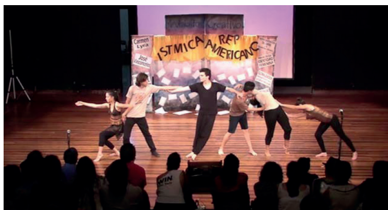
Fotografía 9. Una opción de acercamiento, exploración y convocatoria desde la experiencia creativa. Curso Movimiento Creativo. Teatro del Centro para las Artes.

Mi cole era solo de mujeres entonces interactuar con hombres, ya eso es aprendizaje.