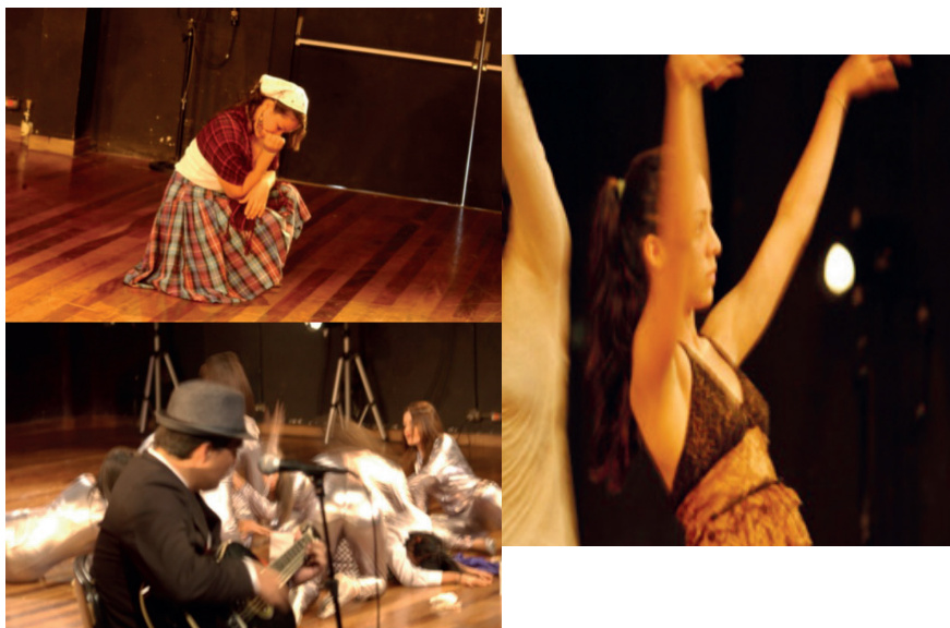
Fotografía 8. EntreTexto: Opción de acercamiento y exploración artística. Teatro del Centro para las Artes, Universidad Nacional, 2013.

Mi cole era solo de mujeres entonces interactuar con hombres, ya eso es aprendizaje.