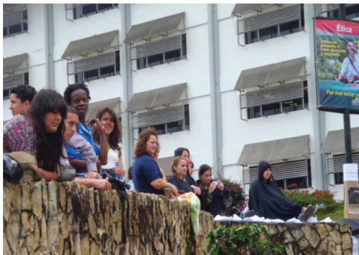
Fotografía 2. Presentación en la Explanada de la Diversidad, Facultad de Filosofía y Letras, 2012.

De tal forma, debe entenderse que esta actividad del performance y del ejercicio creativo no solo facilita romper con moldes y estructuras preestablecidas en los jóvenes estudiantes, sino también que provoca e impulsa al personal docente a entrar en esa misma sintonía, si lo que se pretende es motivar a los estudiantes a la experimentación. Stokoe y Sirkin (1994) nos hablan de una metodología para orientar al docente en la dirección de procesos creativos: