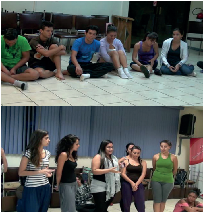
Fotografía 5. Aprendizaje desde nuestras prácticas.

“Es interesante ver lo que Carmen Lyra vivió en aquella época, ahora conozco y sé lo que hizo por nosotros.