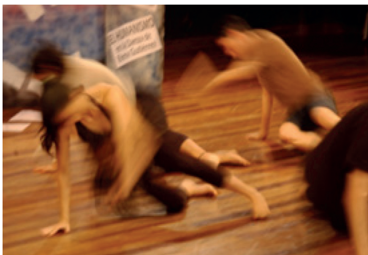
Fotografía 7. Ensayo del EntreTexto. Centro para las Artes, Centro de Estudios Generales Curso Movimiento Creativo, Universidad Nacional 2013.

Yo siempre he pensado que todos los sueños son alcanzables, pero al hacer eso me reafirmó esa enseñanza.