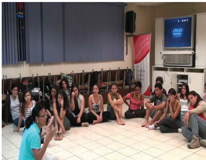
Fotografía 4. Preparación del guión en el aula. Curso de Movimiento Creativo.

A mí en lo personal siempre me da miedo presentarme ante la gente, me gustó la experiencia.