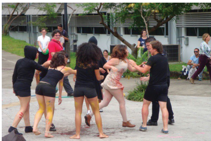
Fotografía 1. EntreTextos: Del texto al movimiento. Plaza Constantino Láscaris, Facultad de Filosofía y Letras, UNA.

Algunas definiciones de creatividad que enriquecieron la experiencia práctica facilitaron ampliar conceptos para darle solución a situaciones sobre problemas planteados. Para Taylor (1975), los procesos de creatividad consisten en “un sistema que implica a una persona que da forma o diseña su ambiente transformando problemas básicos en salidas fructíferas facilitadas por un ambiente estimulante” (s/p). Con esta premisa, el estudiantado debió aprender a reconocer, en sí mismo, cualidades y características que les identificaran como personas creativas.