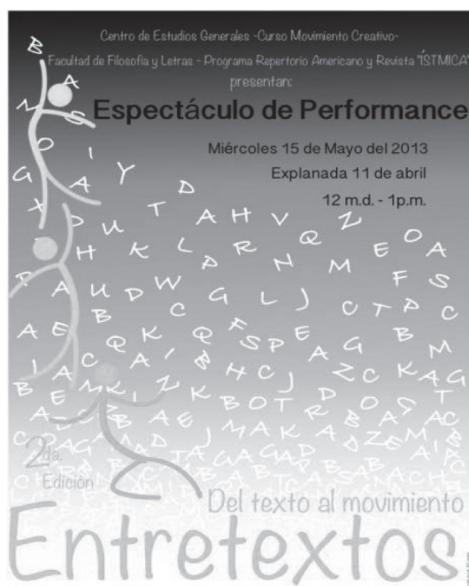
Figura 2. Afiche de EntreTextos , segunda edición, 2013. Material elaborado por Valeria Flores.

Repertorio Americano es una revista muy importante, con una gran tradición en el pensamiento cultural latinoamericano. En momentos celebratorios del 40 aniversario de fundación de la Universidad Nacional, el acercamiento de las personas estudiantes a este impreso tiene un gran sentido simbólico, ya que esta fue la primera revista académica de la Universidad en sus momentos genesiácos, en 1974.