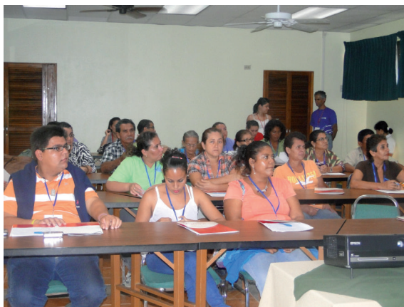
Figura 4. Charlas introductorias sobre gestión de residuos sólidos.

La gira a la EARTH se estructuró en dos áreas de aprendizaje: demostración de las tareas que desarrolla la comunidad universitaria en el manejo integral de residuos sólidos, e identificación de los diversos sistemas agroecológicos de cultivo que se promueven como prácticas modelo a nivel comunal. Mediante charlas, visitas guiadas y demostración en campo, se facilitó un espacio para intercambiar inquietudes, preguntas, y saberes sobre cómo reutilizar los residuos, y de qué manera generar en casa sistemas de cultivo sustentables.