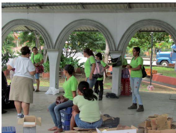
Figura 2. Mujeres de Manos a la Obra en campaña de recolección de residuos sólidos.

El Instituto Mixto de Ayuda Social (IMAS) contribuye, por medio del proyecto Manos a la Obra , a brindar un subsidio económico a familias de escasos recursos económicos. Para acceder a esta ayuda, las personas participan en trabajos voluntarios asociados con temas comunales o ambientales en coordinación con las municipalidades. Durante el 2013, el grupo de mujeres conformado en Santa Rita, estuvo colaborando en la recuperación de residuos sólidos.