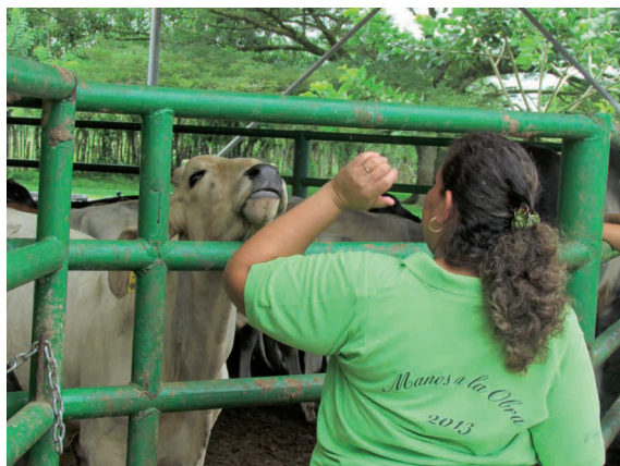
Figura 14. Visita a la finca pecuaria.

Campus universitario de la EARTH, 22 de agosto de 2013.