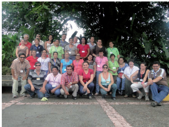
Figura 16. Grupo de personas participantes en la gira a la EARTH.

Cuando se pregunta sobre las razones por las cuales se volvería a participar en una segunda gira, se expresan comentarios asociados con la experiencia de aprendizaje: “Me pareció muy importante y vi cosas que no imaginaba que existían”; “Fue una experiencia muy bonita y aprendí muchas cosas que no sabía”. También se asegura que la gira deja un recuerdo agradable: “Me encantó”, “Fue mi primera experiencia y me gustó mucho, todo fue excelente”.