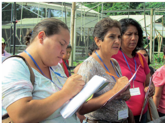
Figura 10. Visita a la finca periurbana. Campus universitario EARTH, 22 de agosto de 2013.

Asimismo, como se muestra en la tabla 1, se menciona el interés de aprender sobre manejo de residuos sólidos, aprovechar todos los aprendizajes, compartir con el grupo, y lograr proyectarse como cooperativa. Se expresa la intención de aprender sobre prácticas de reciclaje, procesos para la elaboración de abono orgánico y distintos tipos de sistemas agrícolas.