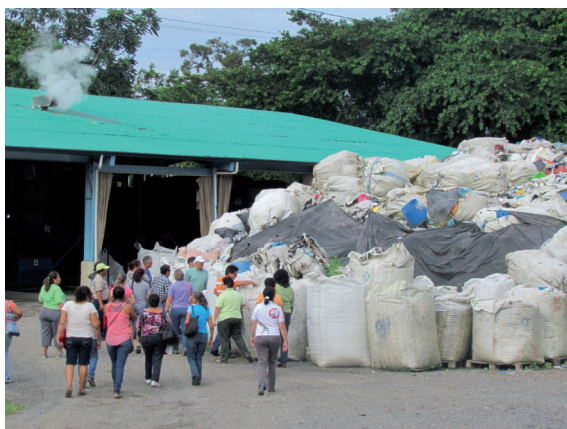
Figura 7. Visita guiada a la empresa procesadora de plástico RECIPLAST.

Una visita guiada a las instalaciones de la fábrica y a su planta de tratamiento de aguas residuales contribuyó a demostrar, con ejemplos concretos, cómo se procesa y transforma el plástico en la elaboración de cajas empacadoras de productos de exportación; así como la manera en que la empresa ha contribuido a disminuir los niveles de deforestación, mediante el diseño de este tipo de artículos plásticos.