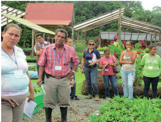
Figura 9. Visita a la finca periurbana.

Guácimo, 21 de agosto de 2013.