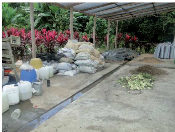
Figura 11. Sistemas de elaboración de abono orgánico.

En cuanto al manejo de agroecosistemas, la propuesta de la finca periurbana, con sus diversos sistemas de cultivo y las distintas formas de elaborar abono orgánico, también son actividades que relacionan con las tareas que ejecuta COOPECOSARI. El sistema de tratamiento de excretas identificó principalmente a las personas que se decidan a la cría y cuidado de cerdos.