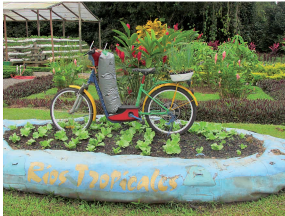
Figura 13. Sistemas de agricultura reutilizando desechos sólidos.

Finca periurbana, campus universitario de la EARTH, 22 de agosto de 2013.