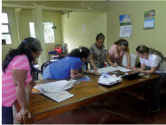
Figura 3. Taller sobre Plan estratégico. Mujeres de COOPECOSARI trabajando en la definición de un plan de trabajo como cooperativa.

Centro Agrícola de Nandayure, Santa Rita. 20 de junio de 2013.