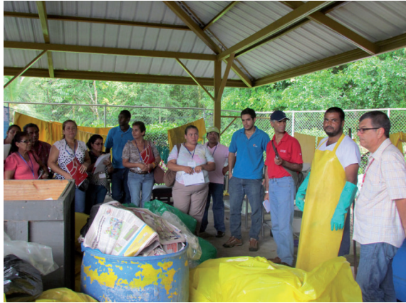
Figura 5. Visita guiada al centro de recuperación de materiales.

Este es un programa que incentiva y compromete a la comunidad universitaria a realizar una correcta separación de los residuos sólidos. Ante la iniciativa de la organización COOPECOSARI y el proyecto Manos a la Obra , de abrir en su comunidad un centro de acopio, se consideró pertinente que las personas participantes conocieran cómo se administra y gestiona un centro de acopio.