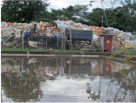
Figura 8. Planta de tratamiento de la empresa procesadora de plástico RECIPLAST.

Guácimo, 21 de agosto de 2013.