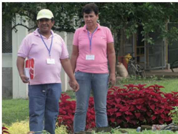
Figura 15. Visita a la finca periurbana. Campus universitario de la EARTH, 22 de agosto de 2013. Archivo del proyecto.