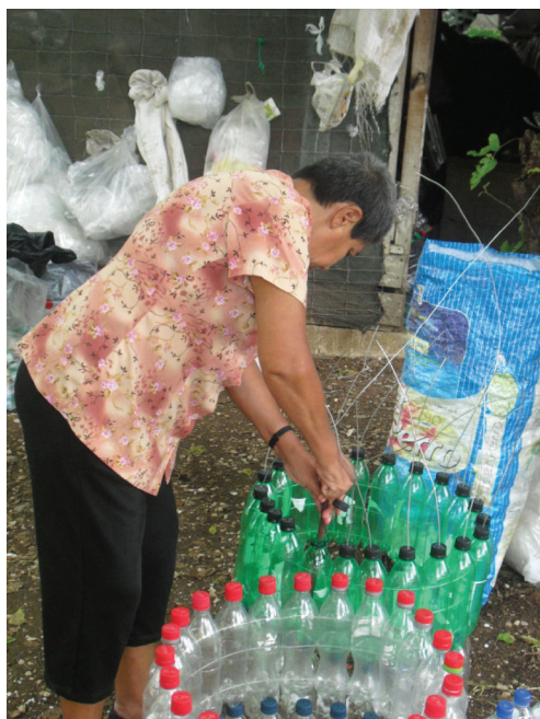
Figura 1. Mujeres de Manos a la Obra elaborando basureros con botellas de plástico.

La Cooperativa de Producción y Servicios de Santa Rita R.L (COOPECOSARI) y el grupo Manos a la Obra son ejemplo de este tipo de esfuerzos. COOPECOSARI nace en el año 2012 con la misión de recuperar residuos sólidos, producir abono orgánico y cultivar plantas medicinales, entre algunas otras tareas grupales a través de las cuales generar ingresos económicos. Una de sus metas futuras es contar con un centro de acopio para contribuir a contrarrestar la práctica de quemar, enterrar y depositar en afluentes del río Morote residuos sólidos.