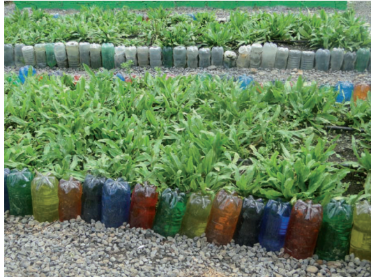
Figura 12. Sistemas de agricultura utilizando botellas plásticas.

Finca periurbana, campus universitario de la EARTH, 22 de agosto de 2013.