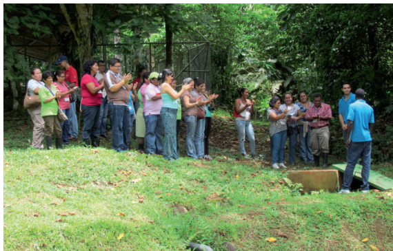
Figura 6. Visita guiada al relleno sanitario.

Campus universitario EARTH, 22 de agosto de 2013.