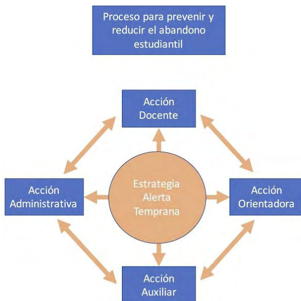
Figura 1. Proceso de atención ante el riesgo de abandono o reinserción estudiantil en el Colegio Nocturno de Pococí.

Nota: elaboración propia de los autores.