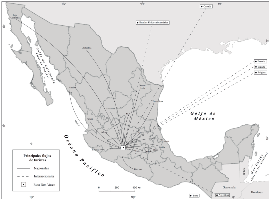
Figura 4. Flujos turísticos nacionales e internacionales a Michoacán.