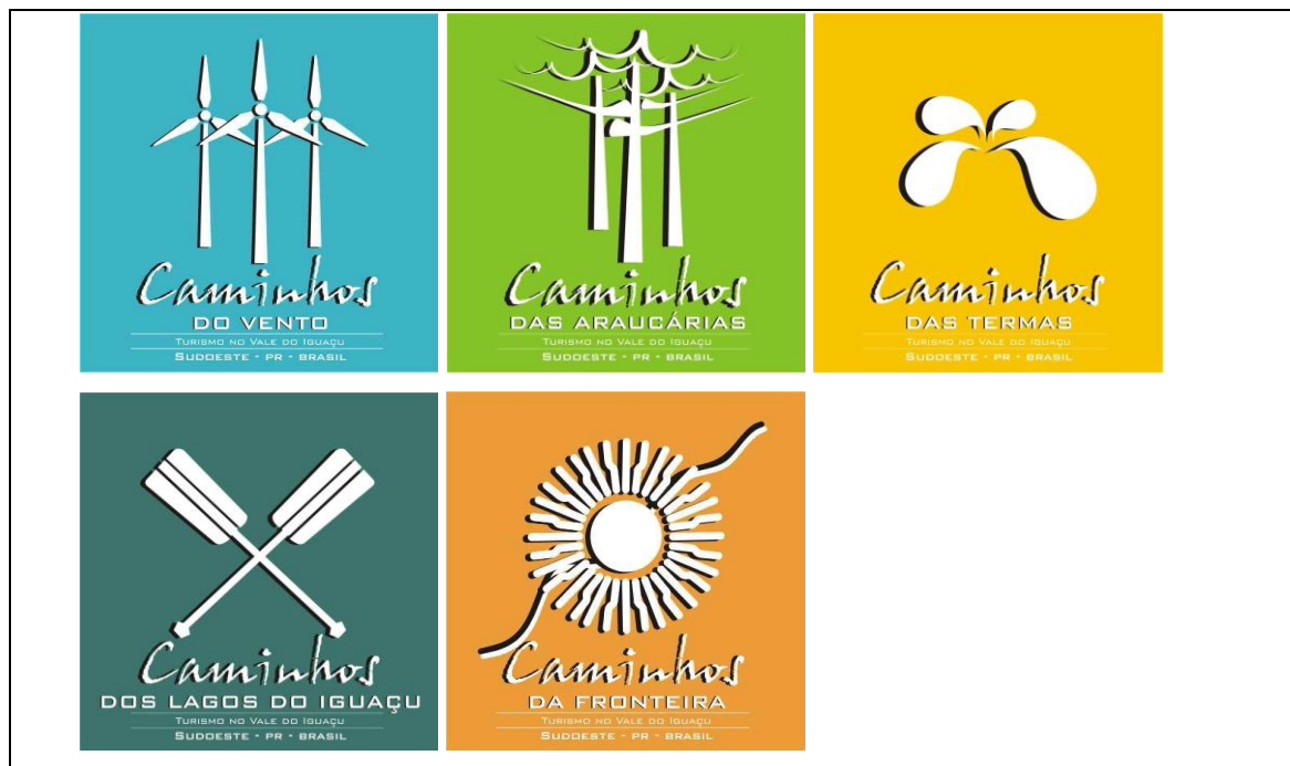
Figura 02: Logomarcas dos roteiros existentes no Sudoeste do Paraná.