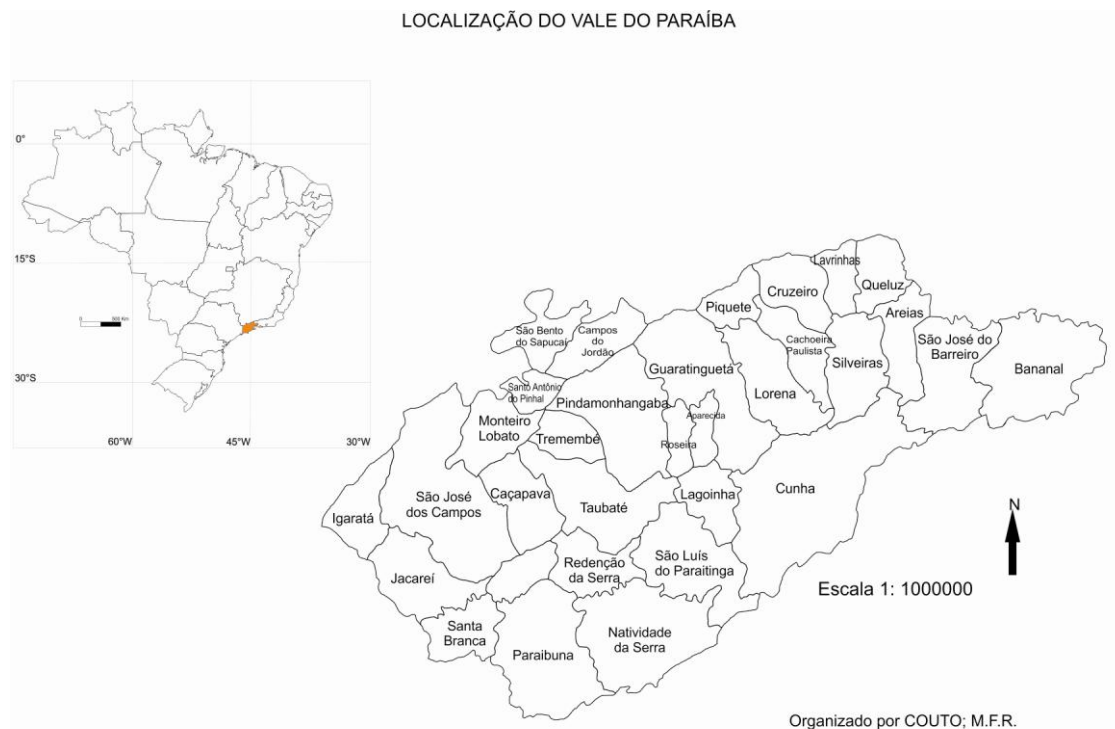
Imagem 1- Localização do Vale do Paraíba no Brasil e seus municípios.

Dessa maneira, busca-se analisar quais as condições atuais das regiões pelas observações in loco e pelas diversas instituições e fundações regionais, que trabalham para conservar e conscientizar sobre a importância da história da região e o potencial turístico que já está auxiliando a economia de vários municípios.