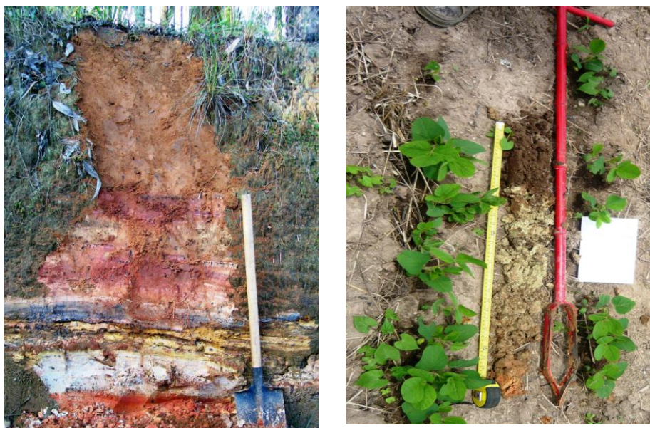
FIGURA 2. Intercalações litológicas da Formação Rio do Rastro em perfis, na Sub-bacia do Rio Boles e camadas pedológicas.

arenitos finos, de cor arroxeadada ou esverdeada, com raras camadas de calcário (parte inferior da unidade). São intercaladas em camadas de grande extensão lateral, com espessuras que variam de centímetros até alguns metros (FIGURA 2). Os siltitos e arenitos se mostram com estratificações cruzadas de pequeno porte, laminação plano-paralela e ou maciça, e as camadas siltico-argilosas apresentam laminação plano-paralela, ondulada, lenticular e flaser (MINEROPAR, 2005).