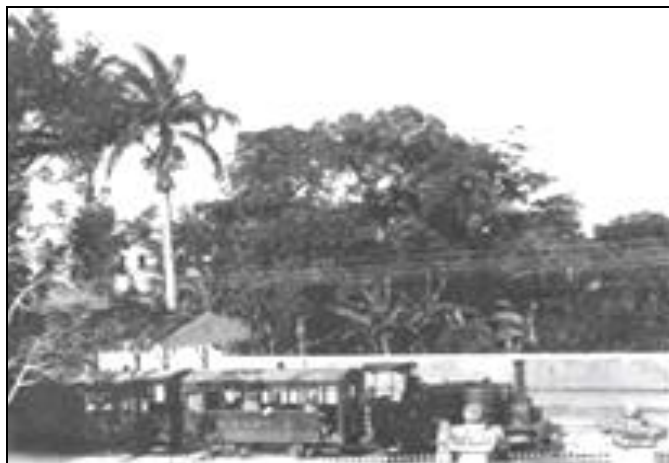
Figura 11 - Marchambomba no Recife