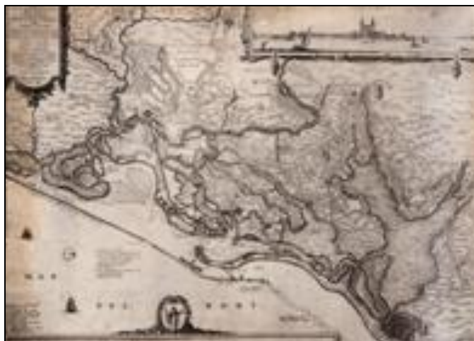
Figura 4 - Recife, Olinda no Período Holandês