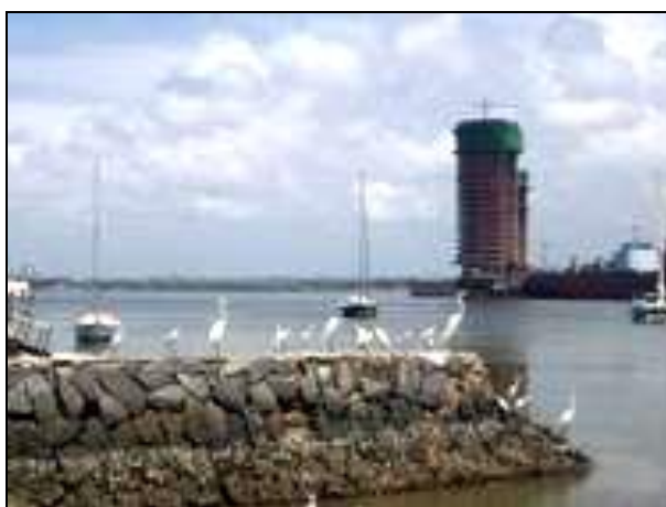
Figura 15 - Torres Gêmeas Ilegais Ecologicamente em 2006

Os “arranha-céus” são construídos nas bordas dos rios, pontuando a paisagem da cidade, embora esta ação seja ilegal, o Código Florestal Brasileiro, promulgado em 1965 ainda em vigor, (Lei 4.771 de 15/09/65), alterado pela lei 7.803 de 15/09/89 e o “Código das Águas”, não permitem construção até 30 metros dos cursos d’água em cada margem. No entanto, nos dias atuais, essas edificações continuam a ser construídas às margens dos rios da cidade, como visto na foto abaixo.