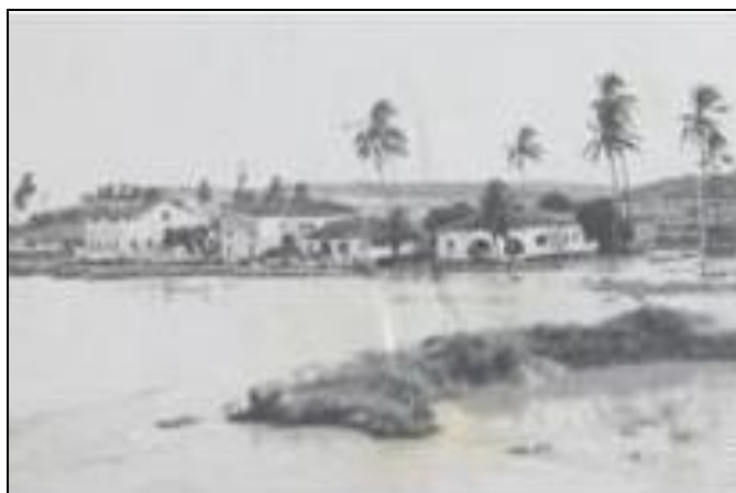
Figura 12 - Caxangá na cheia de 1975

histórico da cidade, a ocupação em larga escala se instala causando aterros do ambiente encharcado do manguezal, provocando problemas de drenagem em toda rede urbana do Recife, comprovado na cheia de 1975 como visto abaixo.