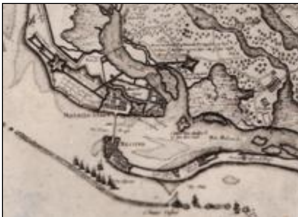
Figura 6 - Recife no Período Holandês

retangular e em formato do plano de Batávia, cortado igualmente por um canal largo que se estendia desde as proximidades do Forte Frederico até a atual igreja do Rosário, com as linhas de orientação das pontes marcando a direção de expansão da cidade 10 .