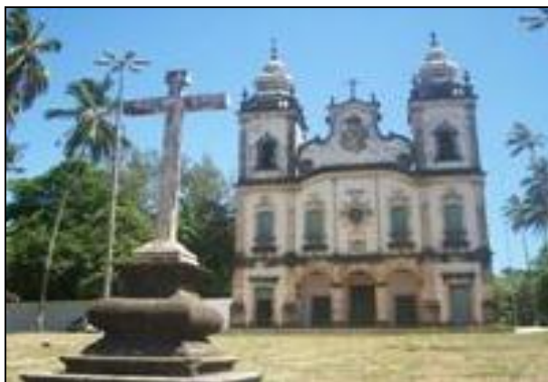
Figura 5 - Igreja Nossa Senhora dos Prazeres

Em homenagem à vitória da batalha dos Guararapes, foi erguida no local uma capela, hoje igreja de Nossa Senhora dos Prazeres, padroeira e defensora religiosa dos luso-brasileiros na contenda.