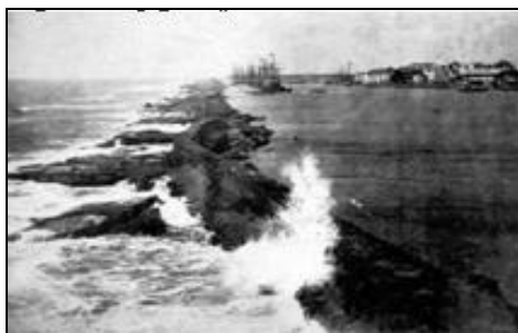
Figura 2 – Porto do Recife

Inicialmente, esta linha de costa servia apenas de porto natural para atraque das naus dos colonizadores portugueses que moravam em Olinda e para embarcar o açúcar produzido nas colinas da Capitania de Pernambuco.