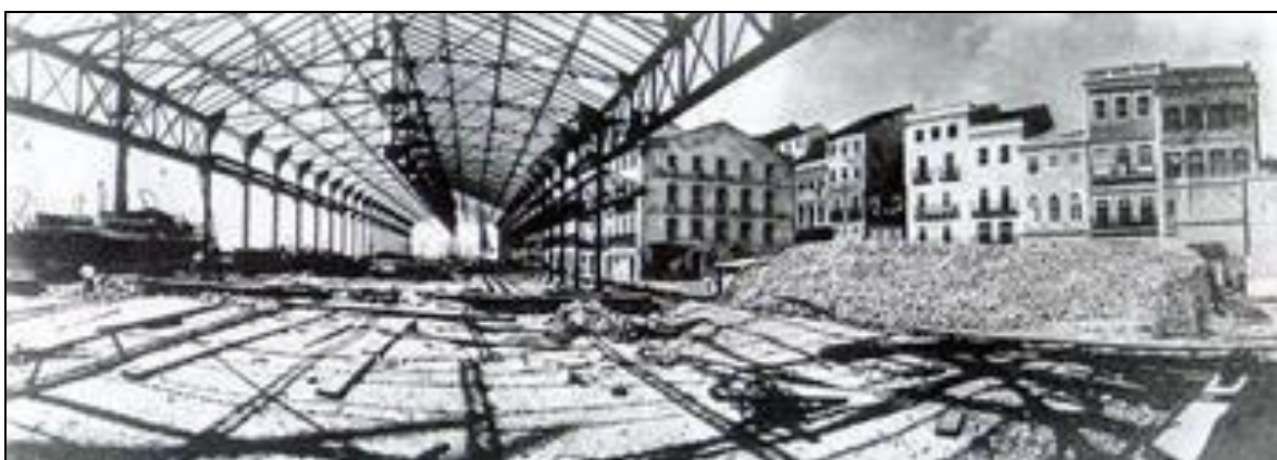
Figura 9 - Modernização do Cais do Porto do Recife

Era costume das cidades europeias da época realizar estas grandes reformas de modernização. O Recife segue esta prática sem cuidar do patrimônio colonial e modifica-se totalmente o desenho urbano.