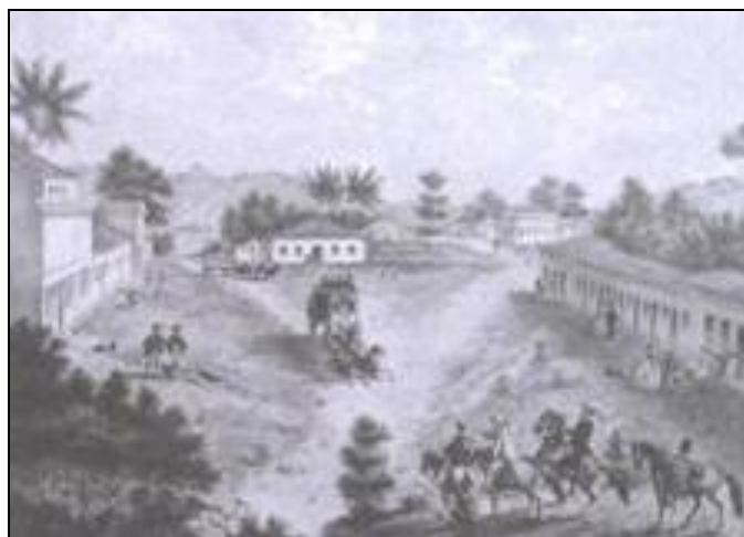
Figura 10 - Arrabalde de Apipucos

Localizados além das terras da Boa Vista, os antigos engenhos, da extensa planície do Rio Capibaribe foram aos poucos perdendo suas funções. Estes engenhos ao serem desativados se tornaram povoados que mais tarde, passaram a ser sítios e, hoje, bairros do subúrbio, – o que permitiu Gilberto Freyre (1971) chamar este conjunto de localidades afastadas de complexo ‘urbano’ das cidades patriarcais.