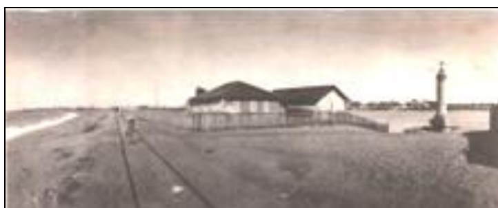
Figura 3 – Cruz do Patrão Porto do Recife

Com a expansão da produção acentuou-se o movimento no cais, a capitania de Pernambuco prosperou, o porto adquiriu maior importância, requerendo afixação de mais pessoas para a atividade portuária e comercial instalada no desembarque, dando início ao povoado do Recife nas cercanias do porto e da Cruz do Patrão.