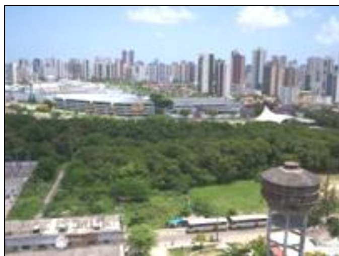
Figura 17 - APA do Jordão

A APA específica do Rio Jordão, no médio curso do rio, é caracterizada pela presença de mangue e da vegetação periférica conforme foto abaixo.