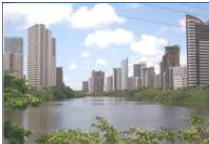
Figura 14 - Rio Capibaribe no Bairro da Torre

autóctones desta natureza e dos bairros vizinhos.