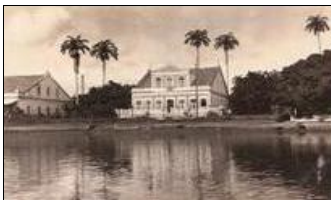
Figura 7 - Casa Grande às margens do Capibaribe

Menezes (1991) conclui que era apreciada uma outra perspectiva da cidade, quando era vista a partir do rio, de dentro para as margens, “é como se as margens fossem descobertas por quem navegava”, conforme visto na fotografia abaixo.