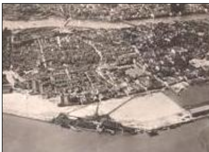
Figura 13 - Aterros no Cais de Santa Rita

Assim, grandes foram os aterros, os desmatamentos e a descaracterização da natureza, seguidos da expansão imobiliária ocorrida às margens do curso dos rios e dos bolsões de manguezal ainda existentes com observado abaixo na fotografia de um avião em 1945 do cais de Santa Rita.