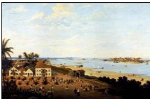
Figura 1 – Chegada de Maurício de Nassau ao Recife