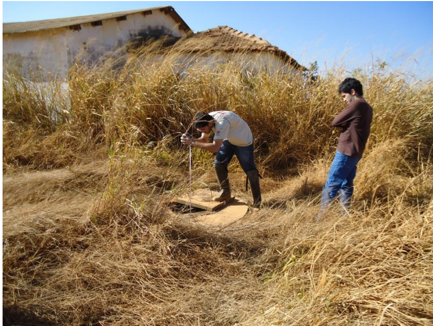
Figura 6 – Poço de monitoramento, Estância Buritís – borda da chapada.