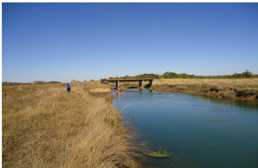
Figura 7 – Local de monitoramento da vazão do rio Uberabinha. SILVA, R. T. S. 2010.

Também estão sendo monitoradas as vazões de saída do sistema hidrográfico afim de posteriormente se elaborar um balanço hidrológico para compreender a dinâmica hídrica superficial da área de estudo.