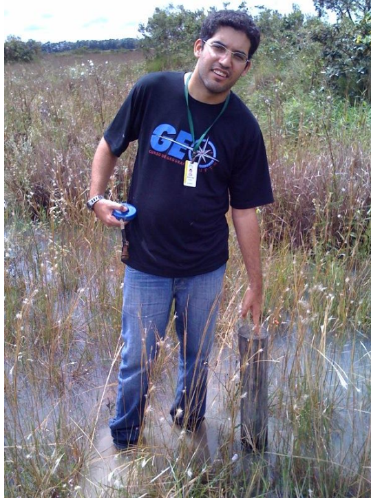
Figura 05: Ponto 2 de monitoramento em que o volume de água se encontra acima da superfície. Autor: DANTAS, A. R. 2011.

úmido de 2,70 m em relação a superfície e nos períodos úmidos, o nível de água chega até a 0,20 cm positivos em relação ao nível do solo.