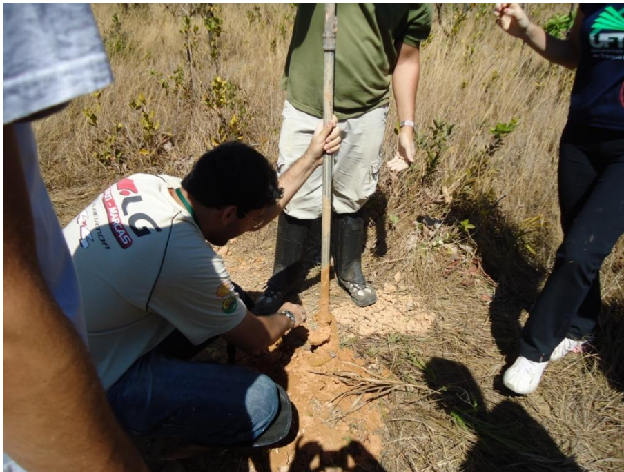
Figura 2. Bolsistas utilizando o trado para perfurar e posteriormente monitorar o N.A. Autor: DANTAS, A. R. 2010.

Os pontos foram escolhidos de acordo com a melhor localização para compreender a dinâmica hídrica da bacia hidrográfica do Rio Uberabinha.