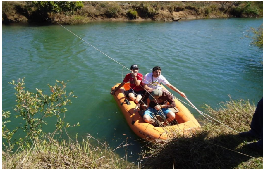
Figura 8: Local onde foram feitas as medidas de vazões. Leito do Rio Uberabinha. Período seco, quando o rio apresenta vazões menores.

O segundo passo foi dividir a seção escolhida do rio em segmentos de 0,5 m para calcular a área do perfil do rio, depois o perfil foi dividido em verticais de 1m de largura para as medições de vazão de cada vertical ou seção. Para o levantamento do perfil de velocidades em cada seção, utilizamos o molinete pluviométrico a 20% e 80% da profundidade (Figura 8).