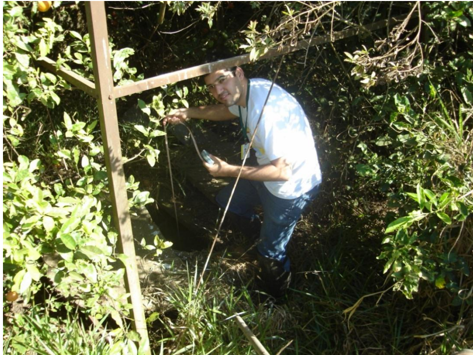
Figura 3. Utilização de cisternas (poços) para monitoramento no N.A.