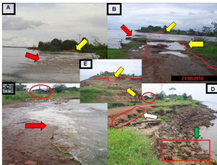
FIGURA 2: A força do fluxo da água sobre as margens (setas vermelhas) A-B e C, provocando o desmoronamento da estrada (setas amarelas) A-B e E, tendo como resultado o surgimento de marmitas na borda do barranco (seta branca) D e queda em blocos depositados no sopé do barranco (seta verde) D.

feições fluviais (barras de meandro, bancos de sedimentação, barras laterais e outros). A destruição de terras na planície de inundação e a redução do valor das propriedades nas margens do rio estão associadas aos tipos de movimentos de massa.