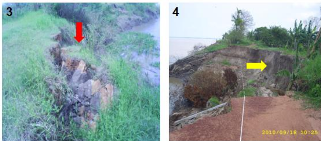
FIGURA 3 e 4: A figura 3 mostra a queda em bloco no sopé do barranco - subida das águas do rio. Na figura 4, é visualizado o escorregamento - tipo rotacional, identificando-se a forma côncava correspondente ao período da descida das águas.