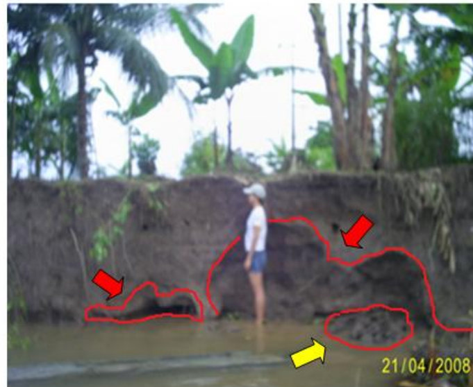
Figura 8: A seta amarela indica os materiais removidos da calha do rio Solimões/Amazonas resultante da erosão das margens por solapamento (setas vermelhas), onde o material acima irá desabar com o auxílio da força gravitacional, desencadeando o movimento de massa.

Regiane Campos Magalhães; Ercivan Gomes de Oliveira; Adoréa Rebello da Cunha Albuquerque; Raimundo Nonato de Abreu Aquino