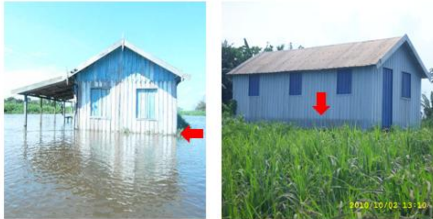
FIGURA 6 e 7: As figuras ilustram o nível da água na maior cheia de 2009, conforme seta vermelha.