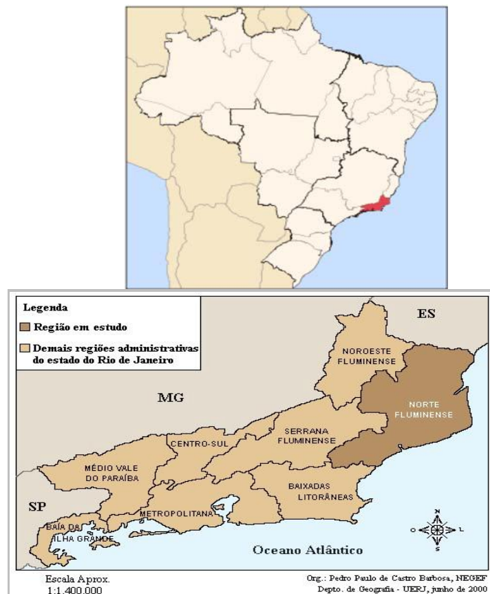
Figura 2: As regiões administrativas do estado do Rio de Janeiro e a região Norte Fluminense.

Bernardes (2003) chamou atenção para o fato de que a região foi marcada por uma agricultura baseada na secular monocultura canavieira em constante crise, quadro esse que se agravou especialmente a partir dos anos 1950 com a concorrência da produção açucareira do interior paulista. Este quadro de crises constantes e de uma agricultura atrasada e tradicional provocou, em graus diferenciados, ao longo do tempo, processos de êxodo rural (Alentejano: 2005). Os anos 1980 e 1990 traduziram-se numa profunda crise econômica, que só viria a ser modificada, em parte, a partir das promessas da riqueza petrolífera com a renovação das esperanças do “retorno” aos períodos áureos (Crespo: 2003).