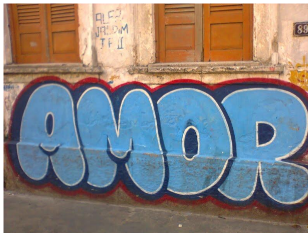
Figura1- Grafite na R. Carlos Gomes

Uma das nossas primeiras estratégias foi entender o lugar como define Santos (1996), “Cada lugar é a sua maneira do mundo. (...) Mas, também, cada lugar, irrecusavelmente imerso numa comunhão com o mundo, torna-se exponencialmente diferente dos demais. A uma maior globalidade, corresponde uma maior individualidade”.