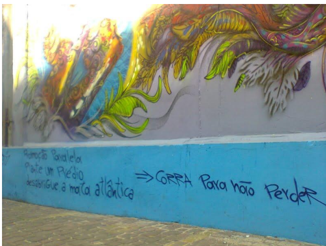
Figura 4 – Segundo tipo predominante