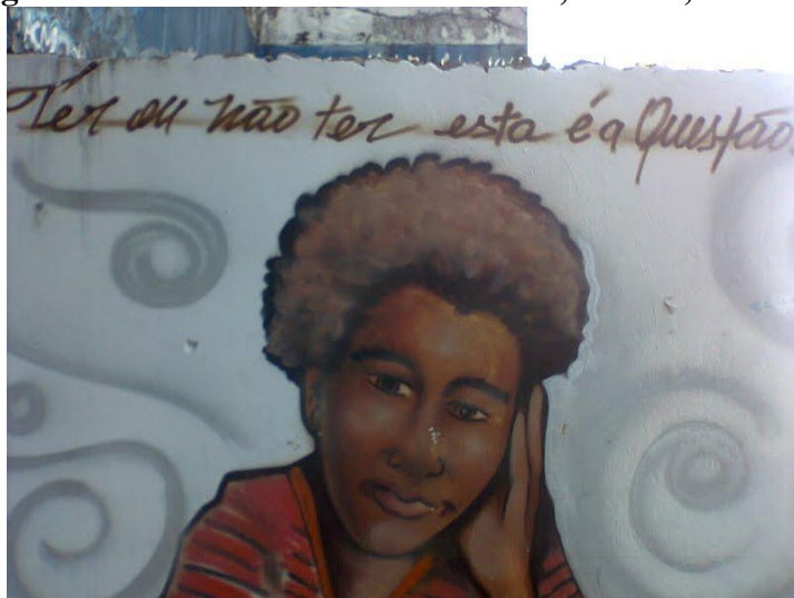
Figura 2- Grafite na Av. 7 de setembro, Centro, Salvador

Para Lopes (2009) “O graffiti marca o corpo da cidade, com inúmeras mãos desejosas, deixando-o carregado de um desejo que se fez realidade. Mesmo que efêmero.” Desta forma, o grafite se configura como a expressão de um movimento político pois o lugar de onde os grafiteiros vêm – periferias pobres, conjuntos habitacionais, bairros populares – estará marcado em cada pintura (Figura 2), em cada ação. E a partir da associação de vários grafiteiros é possível a inserção de mais jovens no processo. Como nos diz Afro, morador da comunidade popular Bairro da Paz: “Em dois mil e cinco eu dei oficina no bairro da paz e até hoje tem alunos que grafitam e que estão fazendo... A arte modifica, a arte transforma; de qualquer forma, eu acho sim que tem um poder de transformação.”