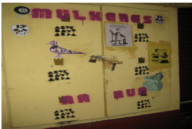
Figura 5- stencil no centro de Salvador Figura 6-stencil no centro de

Através do entendimento desse conteúdo geográfico do cotidiano poderemos, talvez, contribuir para o necessário entendimento (e, talvez, teorização) dessa relação entre espaço e movimentos sociais, enxergando na materialidade, esse componente imprescindível do espaço geográfico, que é, ao mesmo tempo, uma condição para a ação; um convite à ação. (SANTOS, 1996, p.257)