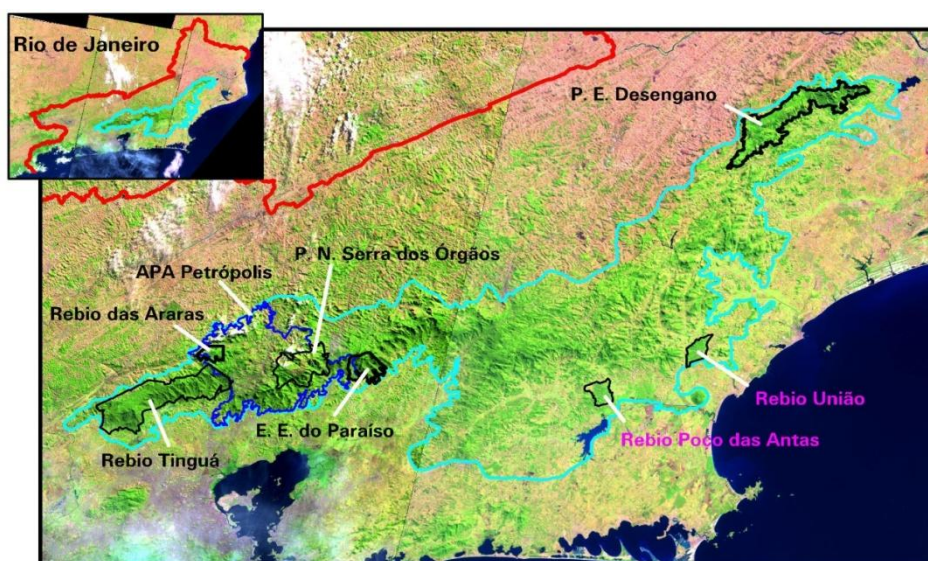
Figura: Localização da APA de Petrópolis dentro do Mosaico de UC's da Mata Atlântica Central Fluminense.

A pesquisa se desenvolve em fragmentos florestais remanescentes da Mata Atlântica, no âmbito da APA de Petrópolis, utilizando-se o estoque de matéria orgânica de superfície como indicador funcional do subsistema de decomposição. A APA-Petrópolis, no âmbito do Mosaico de Unidades de Conservação do Corredor Central Fluminense do Bioma Mata Atlântica (Sistema Nacional de Unidades de Conservação - SNUC), tem um papel importante em garantir o fluxo gênico, pois encerra uma gama variada de tipos de fragmentos florestais entre a Reserva Biológica - Rebio - Tinguá e o Parnaso (Parque Nacional da Serra dos Órgãos).