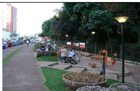
Fig. 3: ATI na parte externa do parque.

O Parque está interdito à visitação pública desde o mês de abril de 2009, em virtude da morte de alguns macacos no seu interior, que a princípio as mortes tiveram a suspeita de febre amarela, mas foi descartada essa hipótese, conforme laudo emitido pela Secretaria de