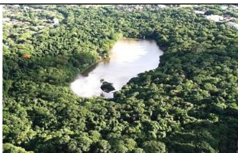
Fig. 2: Foto da reserva florestal do Parque do Ingá.

Atualmente, no lado de fora do Parque do Ingá, há uma Academia da Terceira Idade (ATI 4 ), um conjunto de equipamentos instalados pela Prefeitura do Município em vários pontos da cidade.