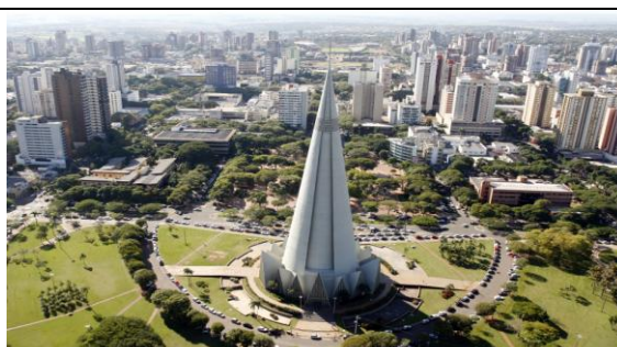
Fig. 5: Catedral Menor Nossa Senhora da Glória.