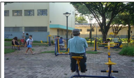
Fig. 4: ATI da Praça da Vila Morangueira.

A Catedral Menor Nossa Senhora da Glória é um monumento arquitetônico reconhecido nacionalmente e internacionalmente (Figura 5):