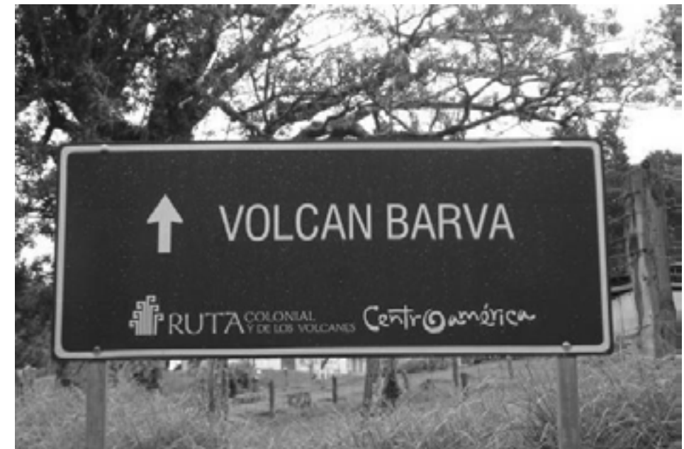
Figura 7. Fotografía tomada por la responsable de la Investigación camino al Volcán Barva, el 5 de setiembre de 2009.

Finalmente, se debe aclarar que a pesar de que en el Plan se menciona que doce de estas señales serían de color azul, sin embargo se pudo constatar que tal disposición no se cumple al menos en la mayoría de los casos. Uno de ellos corresponde a la señal intraurbana colocada carretera