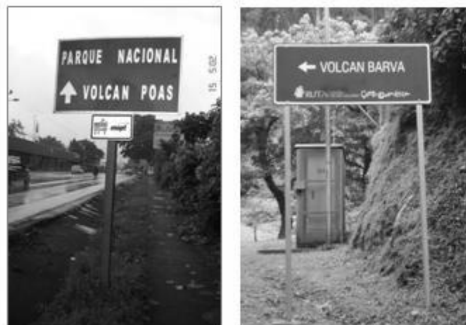
Figura 6. Fotografías tomadas por la responsable de la investigación en la Valencia de Heredia y camino al Volcán Barva, el 25 de agosto de 2009 y el 5 de setiembre de 2009, respectivamente.

Cabe destacar que, a pesar de que ambas señales corresponden a diferentes iniciativas, las mismas serían confeccionadas e instaladas bajo los criterios del Manual Centroamericano de Dispositivos Uniformes de la Secretaría (SIECA). Sin embargo, se puede apreciar que el uso adecuado del color de fondo es distinto. También estas difieren en su forma, pues la primera es menos alargada que la segunda. Además, la información complementaria, en el caso de la primera se ubica en una placa adicional, el caso contrario sucede con la segunda en donde esta aparece en la placa principal. En ese sentido se reconoce el logo de la Ruta Colonial y de los Volcanes y el de la Agencia de Promoción Turística de Centroamérica (CATA, por sus siglas en inglés).