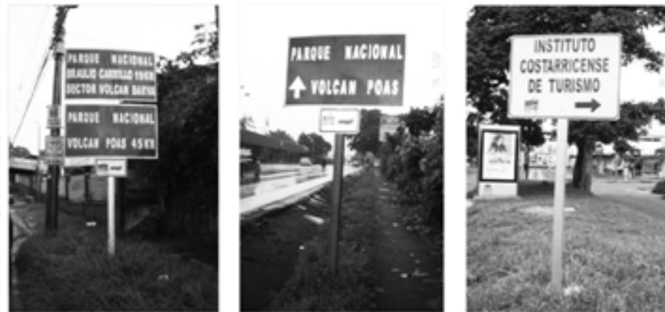
Figura 3. Fotografías tomadas por la responsable de la presente investigación en las cercanías del Automercado de Heredia y en La Uruca; el 25 de agosto de 2009, el 5 de septiembre de 2009 y el 30 de agosto de 2009, respectivamente.

Por otro lado, pese a los esfuerzos realizados por ambos entes para finalizar de forma efectiva el Convenio, algunas situaciones han limitado su ejecución. Entre estas se pueden mencionar: las condiciones climáticas generadas por los fenómenos naturales que han afectado al país, sumado a la contaminación visual de algunas zonas, como consecuencia del exceso de señales publicitarias instaladas por negocios como los hoteles, cuyas características son muy similares a las del MOPT, entre otras.