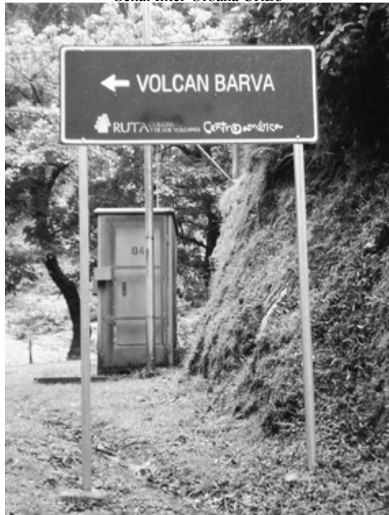
Figura 8. Fotografía tomada por la responsable de la investigación camino al Volcán Barva, el 5 de setiembre de 2009.

Otra particularidad que se puede constatar en dicho documento es que a pesar de que Escazú constituye uno de los nodos turísticos que conforman dicha ruta y de que ha sido asignado como antena de la misma en nuestro país, se ha confirmado que en el mencionado Plan no se propone ni se implementa ningún dispositivo en relación con éste.