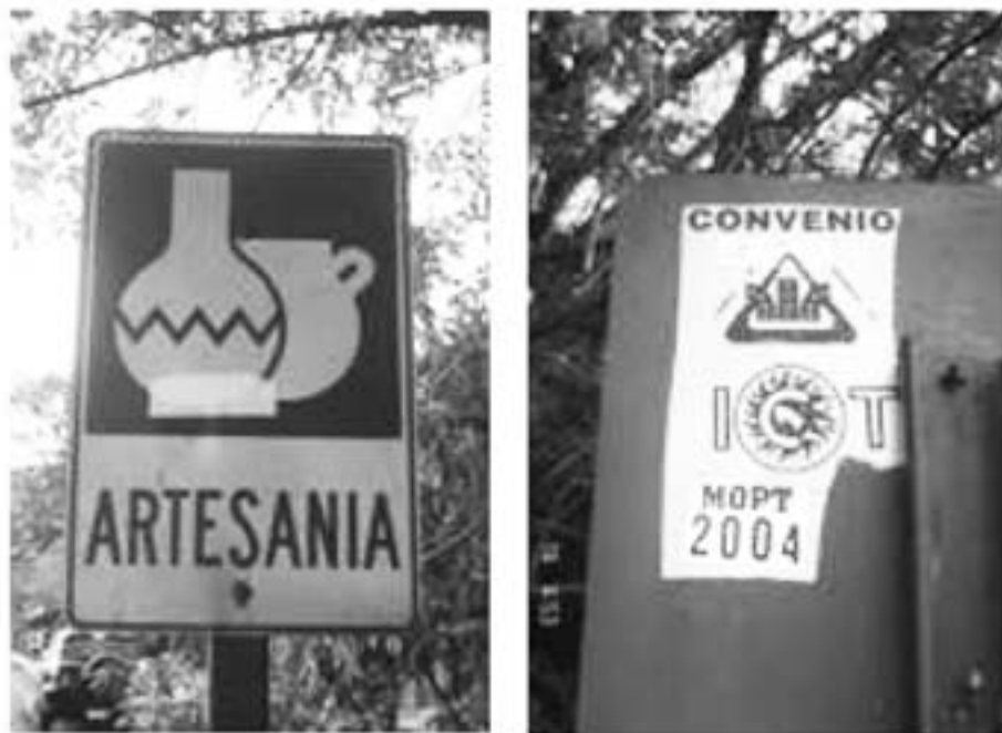
Figura 5. Fotografías tomadas por la responsable de la investigación en Brasil de Mora de Ciudad Colón, el 14 de marzo de 2010.

Cabe destacar que en los Convenios del 2007 y 2009 se ha solventado de alguna forma dicha problemática. Esto por cuanto, el ICT cuenta con un sistema mediante el cual se pueden encontrar aquellas empresas y actividades turísticas que gozan de su respectiva declaratoria, lo que ha facilitado la determinación del tipo de señales a colocarse y su respectiva ubicación. Sin embargo, la finalización del Inventario de Atractivos Turísticos (2008) todavía se encuentra en proceso.