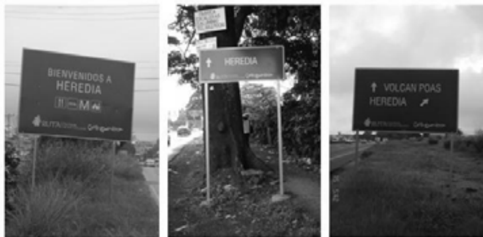
Figura 4. Fotografías tomadas por la responsable de la presente investigación en Heredia, la Valencia y en las cercanías del Aeropuerto Internacional Juan Santamaría; el 15 de agosto de 2009.

La primera señal corresponde a un dispositivo de Bienvenida, la cual se encuentra ubicada en la entrada de la provincia de Heredia viniendo de la CA-1, a N 09°59.533' W 084°06.704'. En cuanto a la segunda, esta es una señal de identificación de ruta localizada en la carretera que une a San José con Heredia al frente de la Agencia Peugeot en el cruce de la Valencia, a N 09°56.852' W 084°06.585'. Respecto a la tercera, se puede afirmar que es una señal direccional en carretera multinodo y se encuentra frente al Aeropuerto Internacional Juan Santamaría a N 10°00.012', W 084°11.581'.