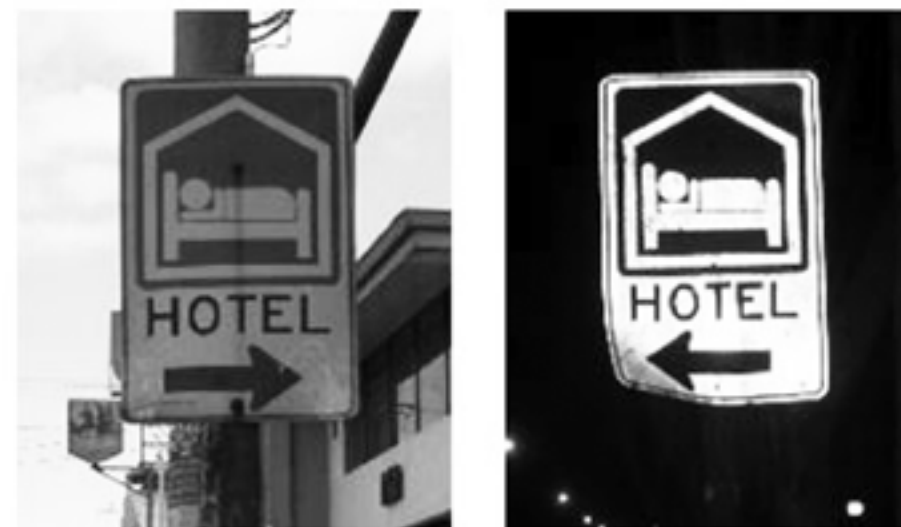
Figura 1. Imágenes adaptadas y modificadas por la responsable de la investigación. Extraídas del “Inventario de Señalamiento Vertical y Horizontal en las diferentes Rutas Nacionales”, MOPT e Ingeniera CSYA, 2008a.

Lo anterior, por tres razones fundamentales. En primer lugar, porque las fechas de colocación de las mismas fueron entre 1993 y 1994, respectivamente, periodo en el que se considera que éste fue concluido (Fernández, 1994). De igual forma, porque dentro de dicho Convenio se ha contemplado la compra de 180 señales con el símbolo de hotel. Finalmente, porque estas se encuentran ubicadas en rutas nacionales: dos que van desde San José hasta Paso Canoas, y 126 que brindan acceso al Volcán Barva, las cuales formaron parte de este documento (Memorando remitido por Chaves, D., dirigido a J. Monge, 18 de noviembre de 1991).