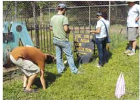
Foto 7 : Campaña de Rotulación en Isla Chira.