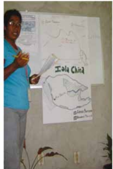
Foto 1: Representante Asociación de Pescadores Cuaderos, Palito de Chira, exponiendo el producto diseñado para su comunidad.

Entre las experiencias de diseño de productos turísticos alternativos, se destaca la comunidad de Puerto Palito de Isla Chira, por su característica geográfica de Isla y por contar con un Área Marina Protegida, a cargo