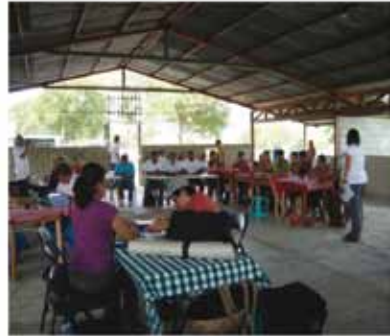
Foto 3: Taller realizado en Corral de Piedra, el 13 de mayo, 2010.

Implementación de buenas prácticas de sostenibilidad turística. Dichos talleres tienen como propósito continuar con la capacitación y el acompañamiento de buenas prácticas de sostenibilidad turística en las comunidades metas, identificando participativamente los instrumentos y las prácticas necesarias para demostrar la aplicación de estas. Tal y como se plantea en la metodología, la ficha 3, muestra los elementos básicos en cada ámbito de la sostenibilidad que se desarrollaron en los talleres de cada comunidad. El desarrollo de dichos talleres se muestra en las siguientes imágenes: