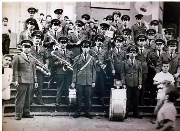
Fotografía 6. Banda municipal en las gradas de la iglesia católica Nuestra Señora de Las Mercedes, Grecia (1961)

Fuente: Facebook “Personajes de Grecia”, https://www.facebook.com/PersonajesGrecia/ . Página administrada por Rodolfo Barillas Acosta. Diseñador gráfico y fotógrafo. Fecha aproximada.