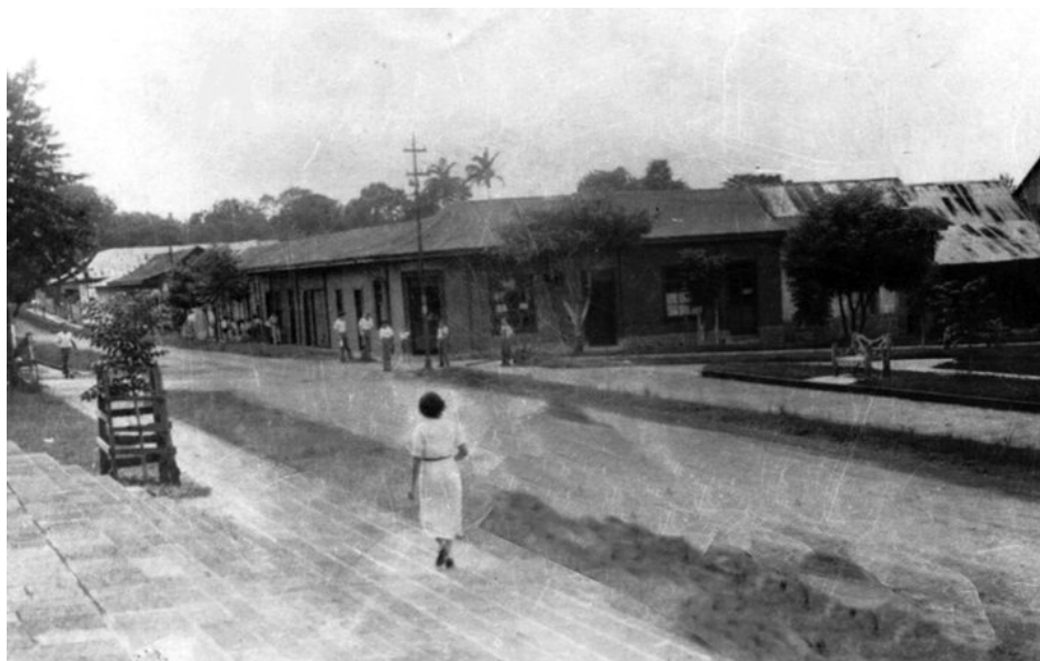
Fotografía 2. Construcciones al costado sur del parque, frente a la iglesia católica Nuestra Señora de Las Mercedes, Grecia (1935)

Fuente: Facebook “Personajes de Grecia”, https://www.facebook.com/PersonajesGrecia/ . Página administrada por Rodolfo Barillas Acosta. Diseñador gráfico y fotógrafo. Fecha aproximada.