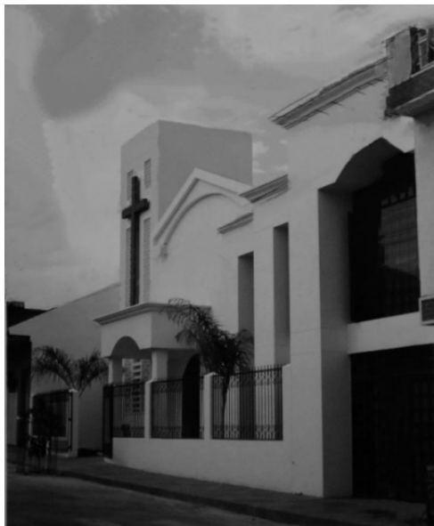
Foto. Iglesia Presbiteriana de Girardot, templo inaugurado en junio de 1958 como monumento conmemorativo del centenario de la Iglesia Presbiteriana de Colombia. Ubicada en la Calle 20 N.º 10-66 de Girardot.

Bogotá, el culto de organización de la Primera Iglesia Presbiteriana se llevó a cabo el 24 de noviembre de 1861, 77 años después en 1938 se construyó el templo de la calle 24 que fue declarado Bien de Conservación Arquitectónica . 136 En Ibagué, la Iglesia fue organizada el 26 de mayo de 1940, en 1950 se construyó su templo, 137 en 1955 se construyó el de Bucaramanga. 138 Ambos templos fueron modernos, espaciosos y mejor equipados en el país para la época. Y así se fueron construyendo los templos en cada municipio donde se establecía una iglesia.