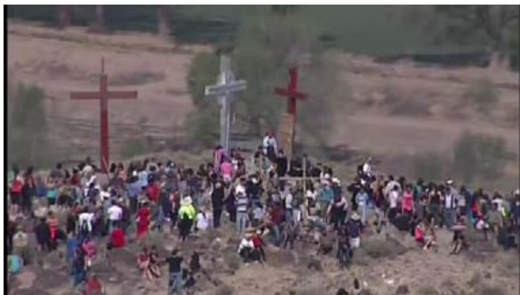
Figura 6. Tomé Hill, Belén, Nuevo México