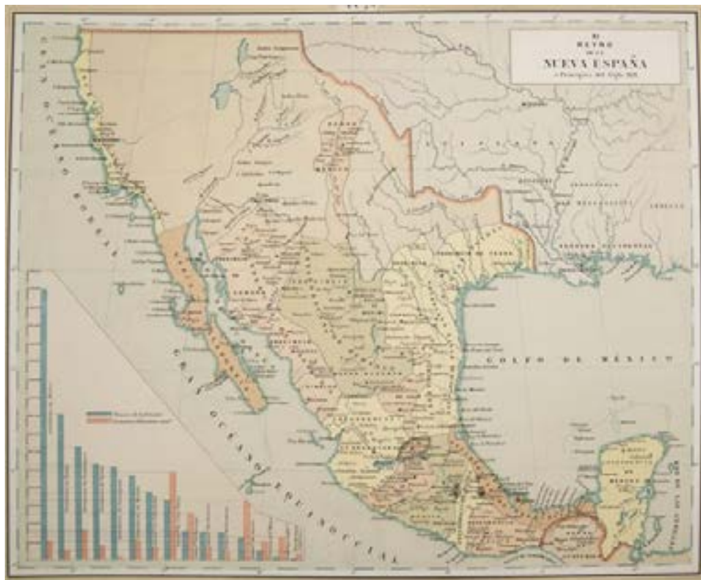
Figura 2. Mapa de la Nueva España