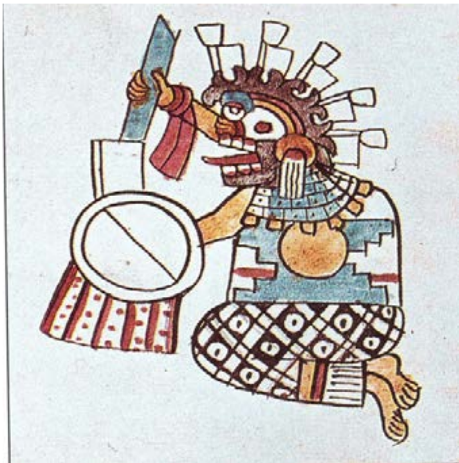
Figura 7. Tlazolteotl