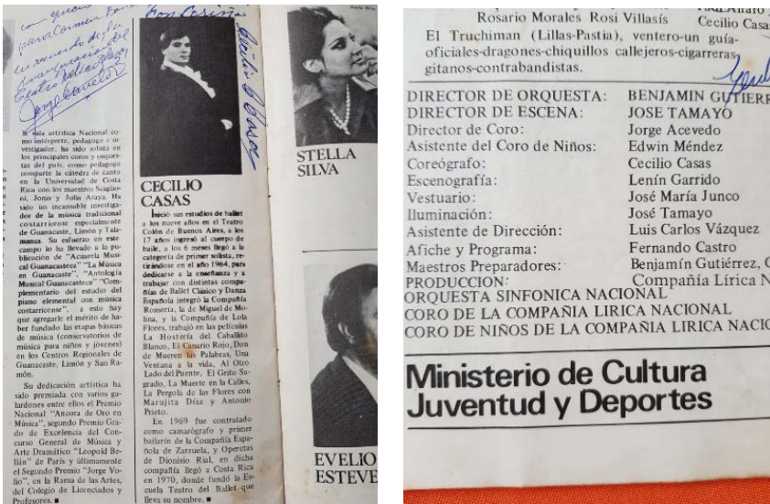
Fotografía 4 Reseña corta en programa de mano

CM: Le agradezco este espacio, la amabilidad, la disposición, es una manera de conocer a todo un artista desde otro punto de vista.