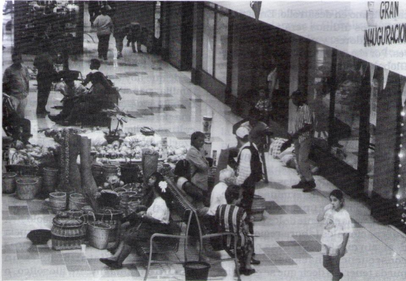
Las etnias nacionales no escapan tampoco al fenómeno globalizador. Mediante la incorporación hacia sistemas capitalistas de producción sufren desintegraciones culturales devastadores.

en crisis desde los años setenta del siglo pasado, a los nuevos retos planteados por el Capitalismo en la segunda mitad de este siglo.