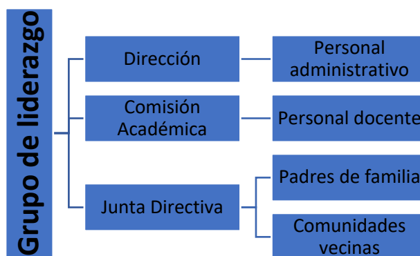
Figura 1 Instancias involucradas y población de atención