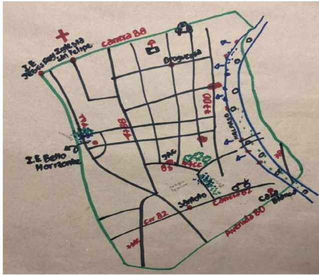
Figura 4. Mapa del barrio Bello Horizonte realizado por el grupo 3

Nota. En el presente mapa, además de los problemas de contaminación alrededor de la ronda de la quebrada Malpaso, los participantes identificaron sitios donde han ocurrido delitos de homicidio y que, en su momento, cambiaron las dinámicas territoriales del barrio. Elaboración propia.