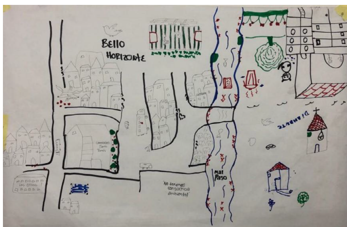
Figura 3. Mapa del barrio Bello Horizonte realizado por el grupo 2

Nota. Identificación de conflictos socioambientales en el barrio Bello Horizonte de la comuna de Robledo por parte de la comunidad, donde se evidencia la quebrada Malpaso como un foco de contaminación y delincuencia. Elaboración propia.