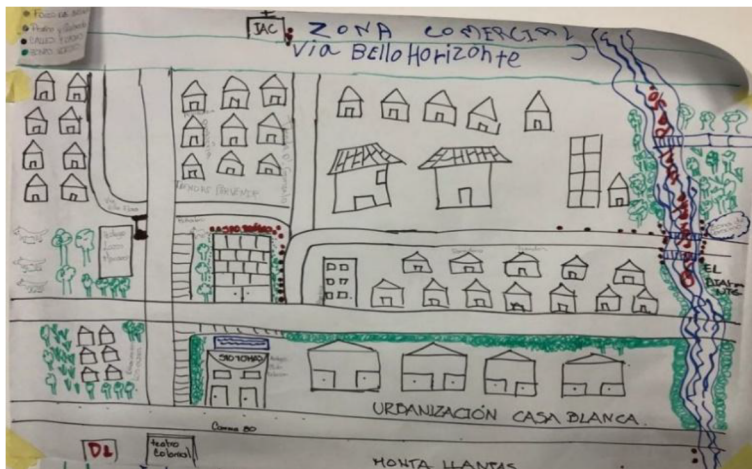
Figura 5. Mapa del barrio Bello Horizonte realizado por el grupo 4

Nota. En el presente mapa, además de los problemas de contaminación alrededor de la ronda de la quebrada Malpaso, los participantes identificaron sitios donde han ocurrido delitos de homicidio y que, en su momento, cambiaron las dinámicas territoriales del barrio. Elaboración propia.