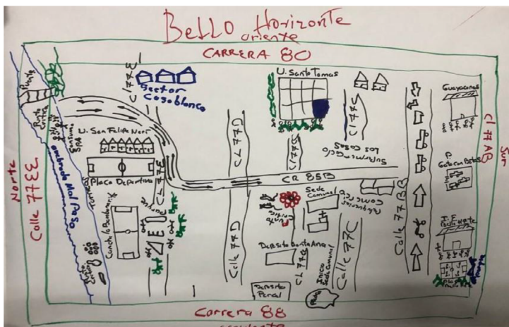
Figura 2. Mapa del barrio Bello Horizonte realizado por el grupo 1

Nota. Identificación de conflictos socioambientales en el barrio Bello Horizonte de la comuna de Robledo por parte de la comunidad, donde se evidencia la quebrada Malpaso como un foco de contaminación y delincuencia. Elaboración propia.