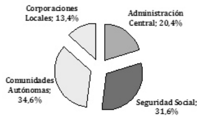
Gráfico 1 Distribución institucional del gasto público en España, 2010