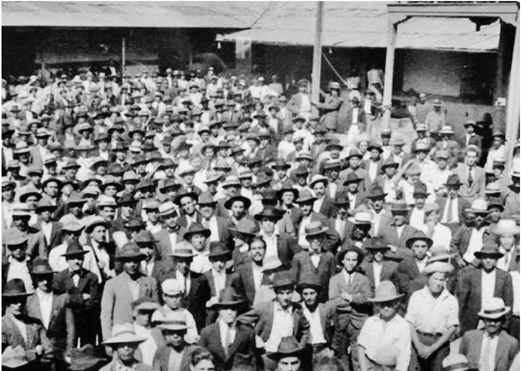
Ciudadanos costarricenses exigen armas en el Cuartel de la Artillería para luchar en la contienda