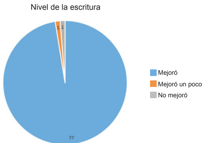
Figura 1. Nivel de escritura después de llevar el curso.

Además, se consultó si aumentó el nivel de escritura después de llevar el curso: setenta y siete estudiantes indicaron que su nivel había aumentado, un estudiante exteriorizó que había mejorado un poco y uno indicó que sus conocimientos acerca de la escritura habían mejorado pero en sí, la escritura se había mantenido como al inicio del curso. (Ver figura 1)