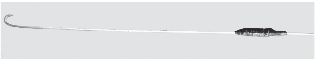
Fig. 2. Arte de pesca (“bichero”) utilizado para la captura de la langosta P. gracilis y demás recursos bentodemersales

Las faenas de pesca de langosta utilizando la modalidad del buceo con compresor son efectuadas por tres tripulantes (dos buzos y un botero) y la duración por viaje de pesca comprende entre 5 y 7 horas. El botero es el que se encarga de dirigir el motor de la embarcación durante las faenas de buceo, además de vigilar la condición de las mangueras que llevan el aire a los buzos durante las inmersiones y el procesamiento de la captura.