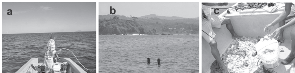
Fig. 4. Botero dirigiendo la embarcación y la manguera (a). Buzos emergiendo con la captura (b). Procesamiento de la captura (c)

Una vez terminadas las inmersiones, o bien, durante los lapsos de estas, se efectúa el procesamiento de la captura a bordo de la embarcación por parte del botero y/o los buzos. Este consiste en el eviscerado, limpieza y desconche de las distintas especies, que luego son almacenadas en el recipiente con agua de mar sin hielo, la cual se cambia regularmente hasta llegar a puerto.