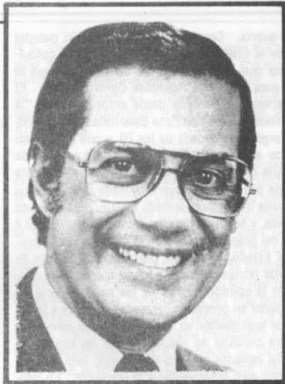
Nicolás Ardito Barletta, presidente de Panamá.

Lo anterior, sin embargo, no debe conducir a un pesimismo a quien haya observado el proceso electoral más detenidamente. Dentro del mismo se han ensayado algunos experimentos unitarios que, aunque sin haber llevado a captar el voto popular en un ambiente de gran polarización, han empezado a abrir la brecha en un espacio que en todo caso es relativamente nuevo para la mayoría de los panameños. Habrá que ver que nuevos ordenamientos se suceden en el futuro, y cómo la coalición ganadora de UNADE puede conciliar sus diversas tendencias, o algunas de ellas buscan expresarse más directamente fuera del gobierno. En ese país, en donde la frustración política todavía no ha llegado a los extremos de El Salvador, y donde la violencia todavía no es el árbitro cotidiano de las diferencias, habrá que ver en qué medida se articulan más claramente las demandas populares, y hasta dónde el sistema de dominación tiene la capacidad de generar un ámbito en que éstas pueden tener un peso verdaderamente efectivo, y no meramente simbólico.