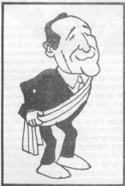
José Napoleón Duarte, presidente de El Salvador.

quier iniciativa que merme el poder económico y político con que cuentan, a la espera que la coyuntura internacional les permita desembarazarse de la molesta influencia del tibio reformismo demócratacristiano. Dudamos mucho que Duarte encuentre apoyo en Estados Unidos para algo más que ayuda militar (y la económica indispensable para no declarar la bancarrota total), continuando el equilibrio inestable que lo continuará minando cada día más. Por otra parte, y en la medida que la guerra se profundiza y extiende incluso fuera del territorio nacional, dependerá cada día más de las decisiones que se toman fuera de su control o influencia.